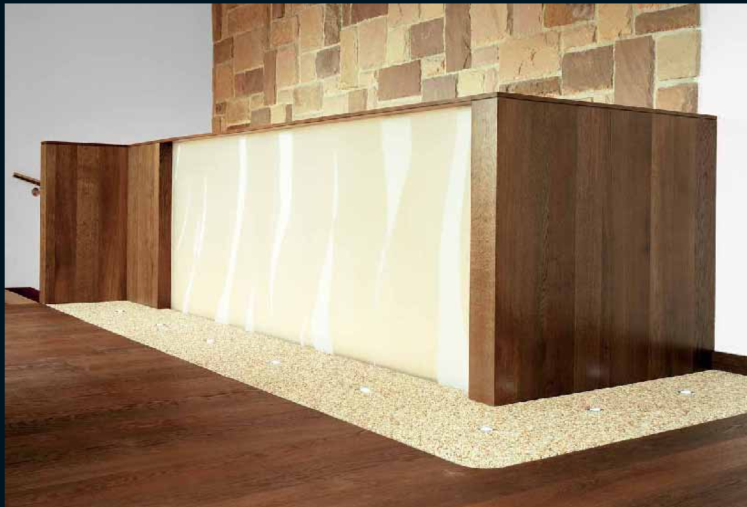
MOCCA ESCHE MEDIUM / Mocca Ash medium / Mocca Frêne medium / Mocca Frassino miele / Mocca Fresno medium