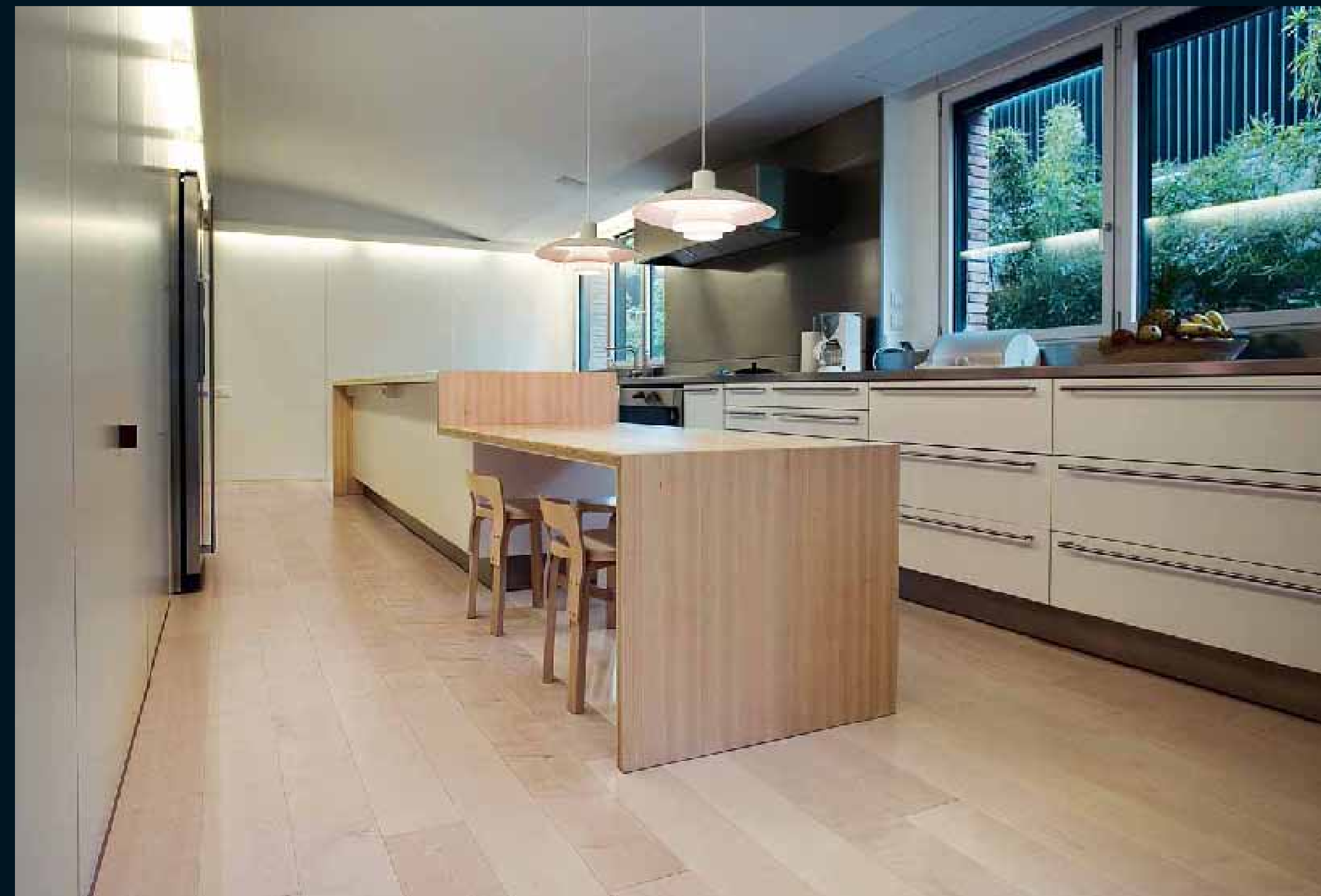
CLASSIC LAUBHOLZ KANADISCHE AHORN / Classic hardwoods canadian Maple / Classic feuillus Erable canadien / Classic latifoglie Acero can. / Classic frondosas Roble can.