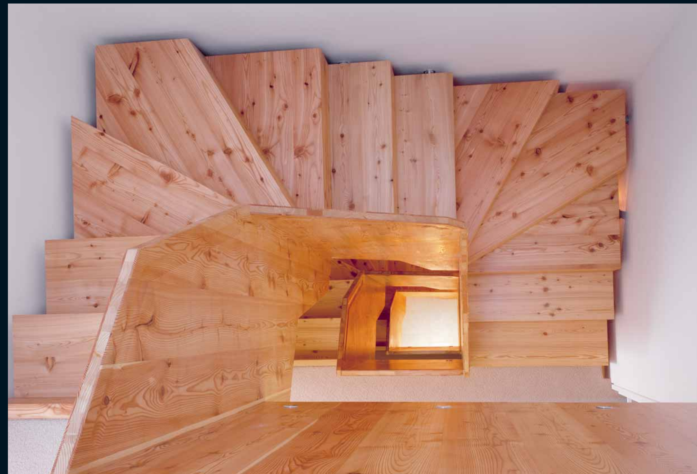
PANEL: GEBIRGSLÄRCHE / Mountain Larch / Mélèze de montagne / Larice di montagna / Alerce de montaña