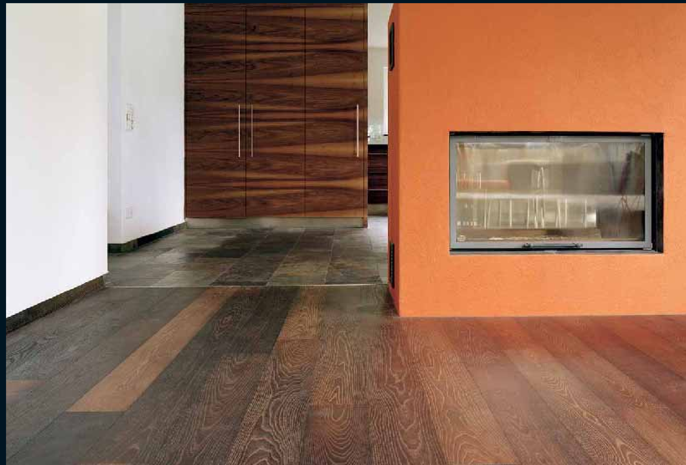
MOCCA ROBINIE / Mocca Robinia / Mocca Robinier / Mocca Acacia / Mocca Acacia