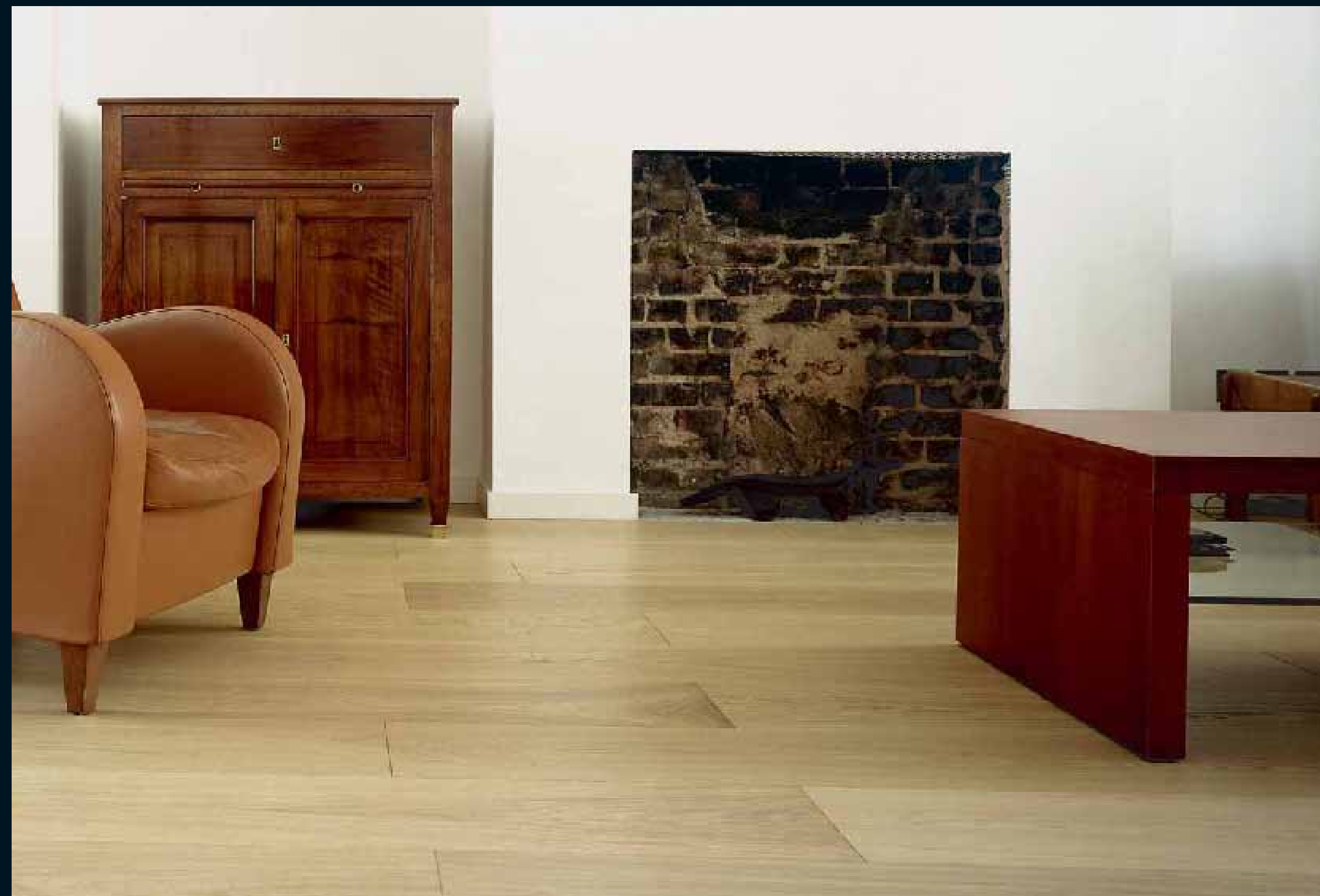
CLASSIC LAUBHOLZ EICHE / Classic hardwoods Oak / Classic feuillus Chêne / Classic latifoglie Rovere / Classic frondosas Roble