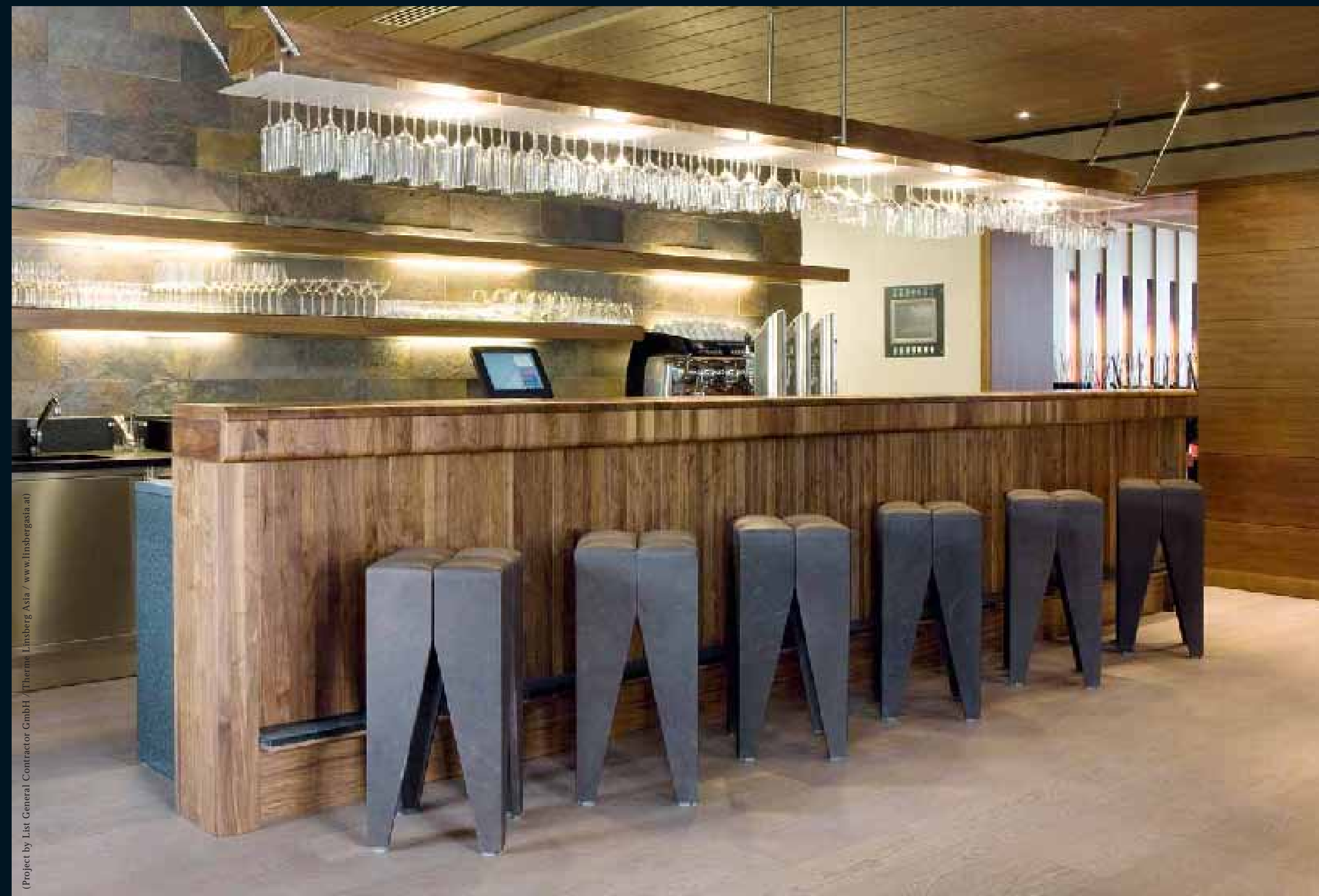
FLOOR: EICHE / Oak / Chêne / Rovere / Roble