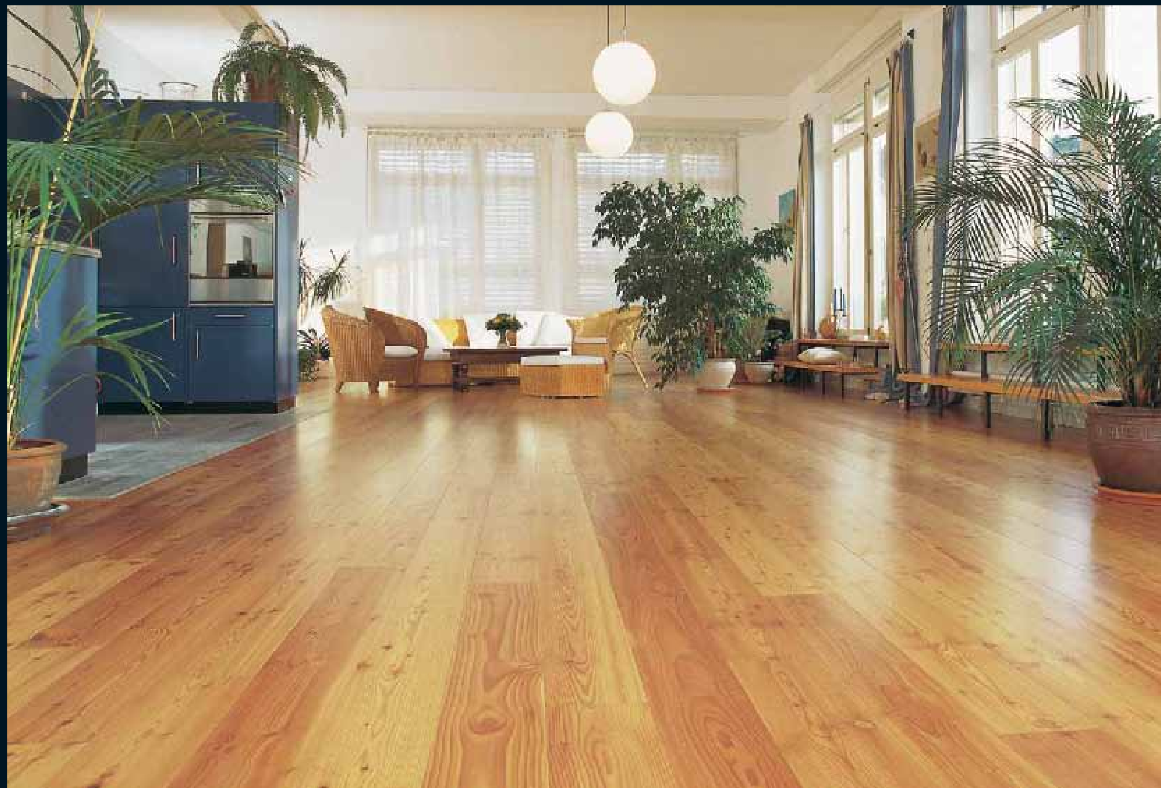
CLASSIC NADELHOLZ GEBIRGLÄRCHEN / Classic softwoods Mountain Larch / Classic résineux Mélèze de mont. / Classic conifere Larice di mont. / Classic coniferas Alerce de mont.