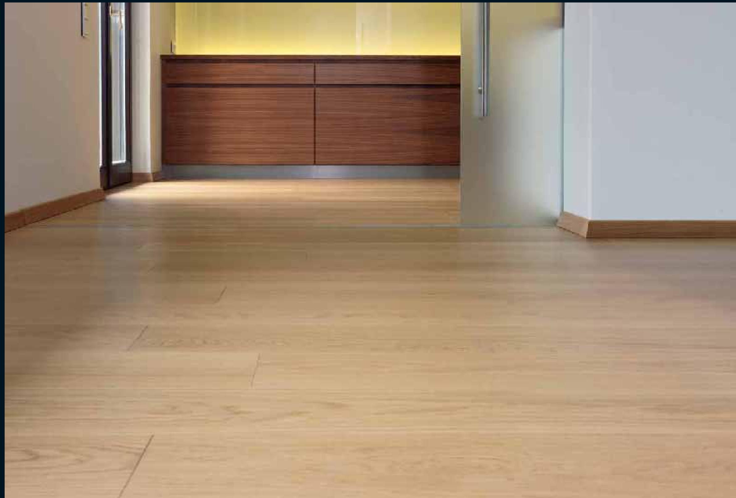
CLASSIC LAUBHOLZ EICHE / Classic hardwoods Oak / Classic feuillus Chêne / Classic latifoglie Rovere / Classic frondosas Roble