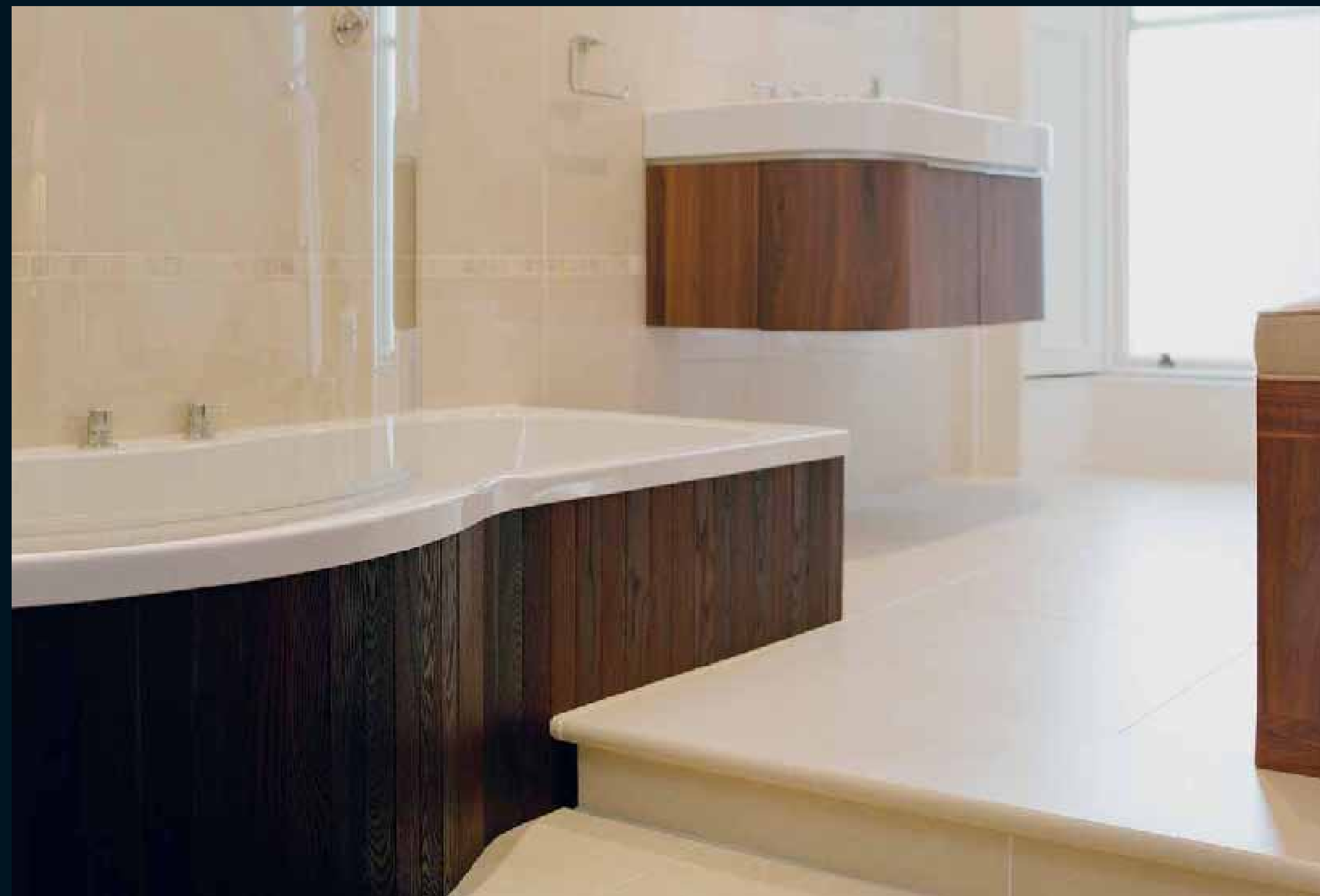
MOCCA ROBINIE DUNKEL / Mocca Robinia dark / Mocca Robinier foncé / Mocca Acacia scura / Mocca Acacia dark