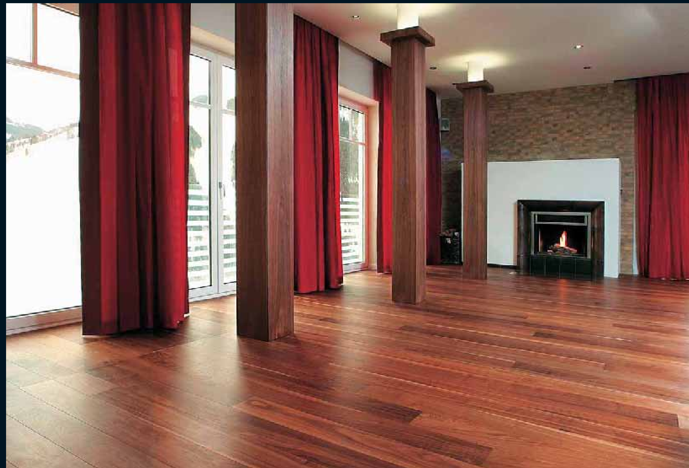
CLASSIC LAUBHOLZ AMERIKANISCHE WALNUSS / Classic hardwoods american Walnut / Classic feuillus Noyer U.S. / Classic latifoglie Noce americano / Classic frondosas Nogal americano