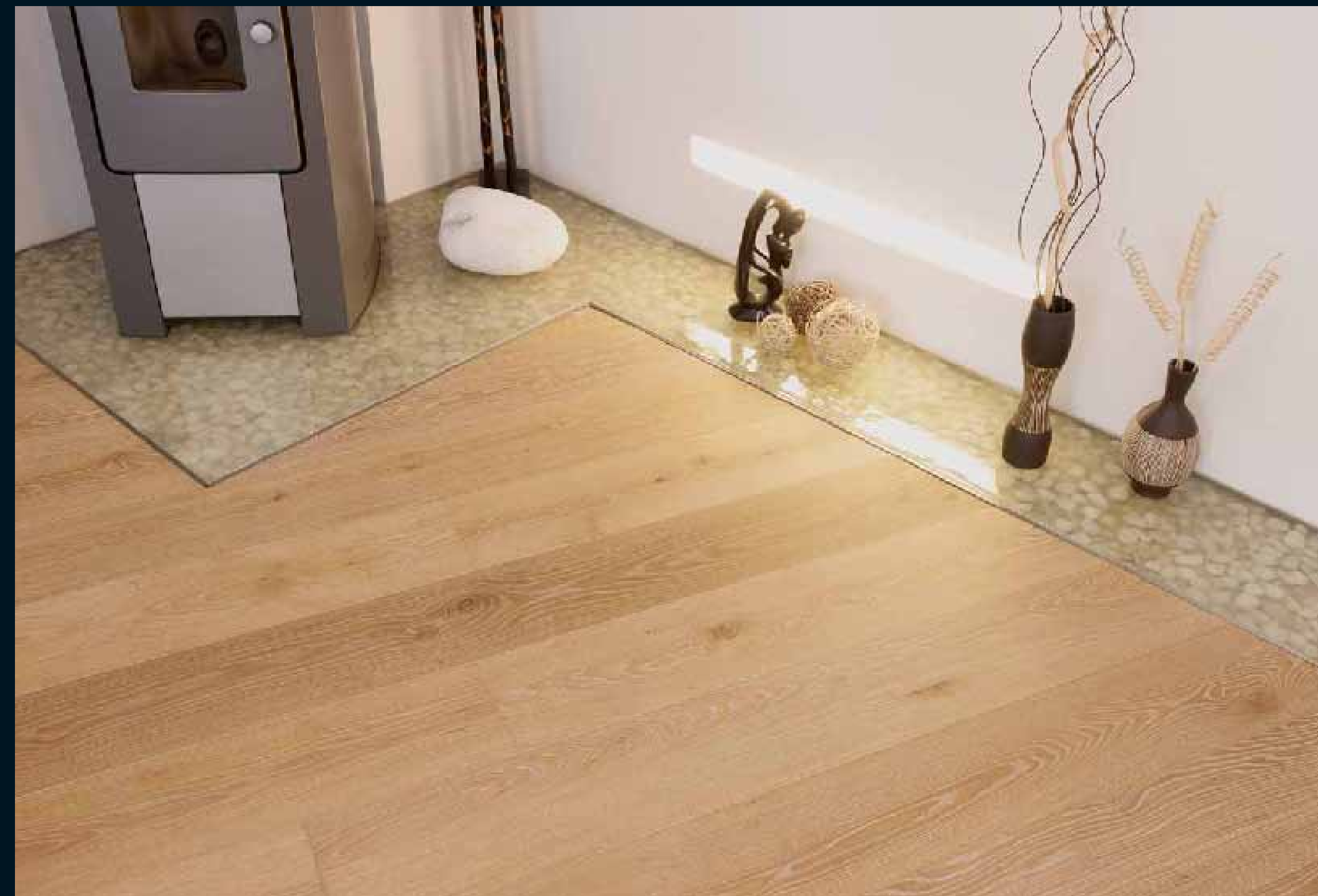
CLASSIC LAUBHOLZ EICHE GEKALKT / Classic hardwoods limed Oak / Classic feuillus Chêne cérusé / Classic latifoglie Rovere sbiancato / Classic frondosas Roble decapado