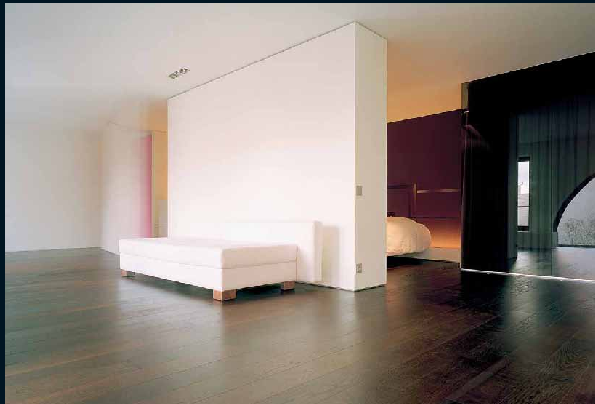
MOCCA EICHE DUNKEL / Mocca Oak dark / Mocca Chêne foncé / Mocca Rovere scuro / Mocca Roble dark