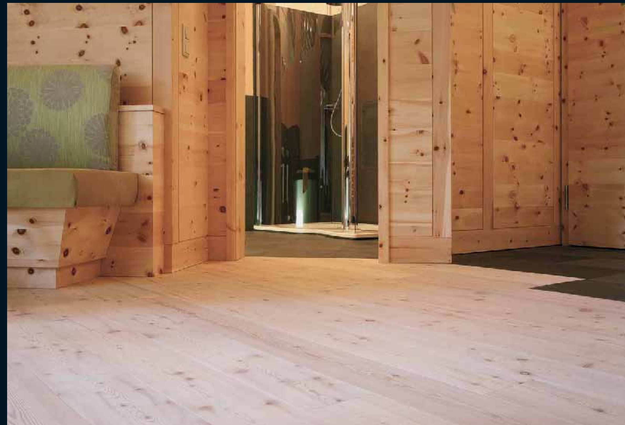
PANEL: ZIRBE / STONE-PINE / AROLLE / CIRMOLO / CIRCLE