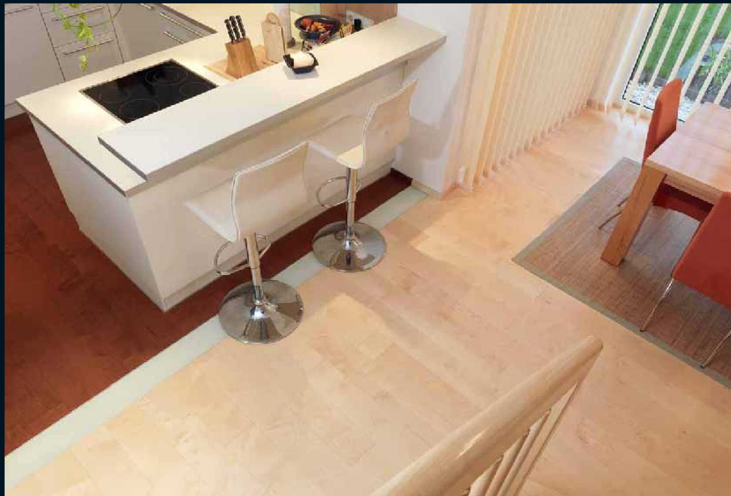
FLOOR DARK: MOCCA AHORN / Mocca Maple / Mocca Erable / Mocca Acero / Mocca Arce FLOOR BRIGHT: CLASSIC LAUBHOLZ AHORN / Classic latifoglie Maple / Classic feuillus Erable / Classic latifoglie Acero / Classic frondosas Arce