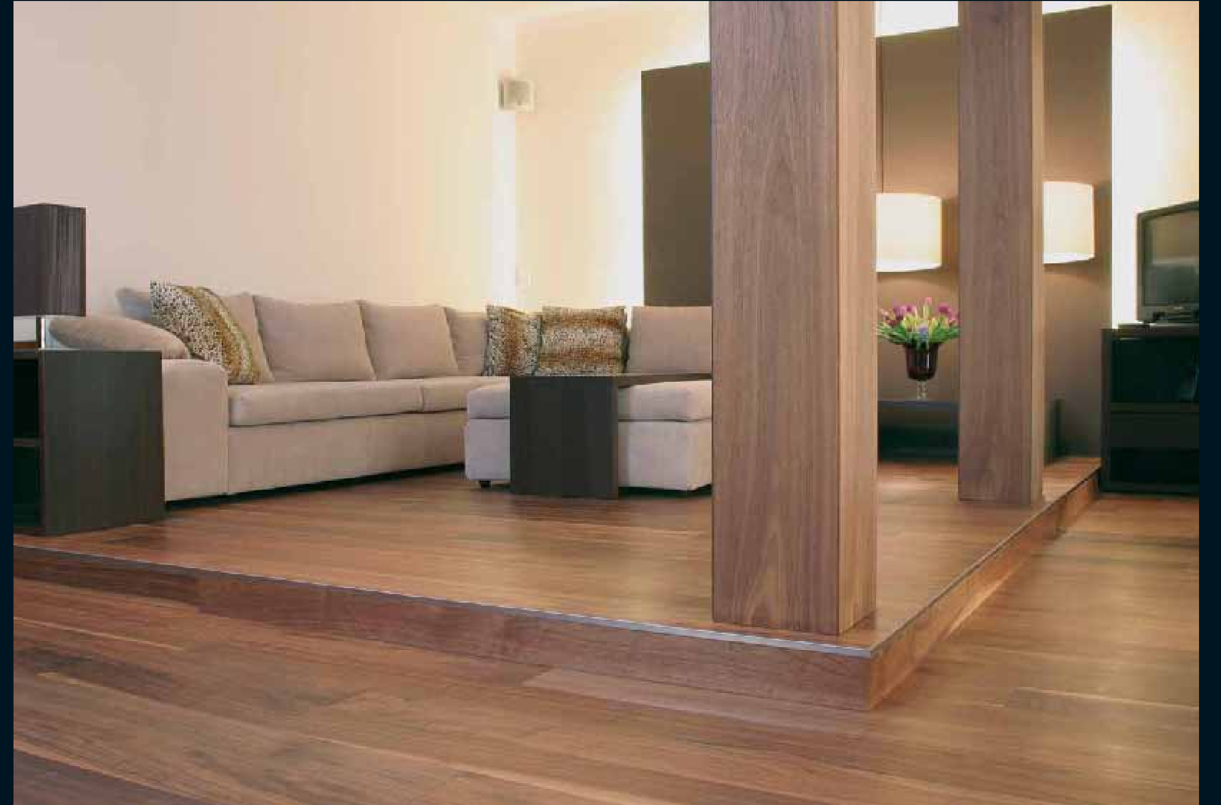
CLASSIC LAUBHOLZ AMERIKANISCHE WALNUSS / Classic hardwoods Americ. Walnut / Classic feuillus Noyer U.S. / Classic latifoglie Noce americ. / Classic frondosas Nogal Americ.