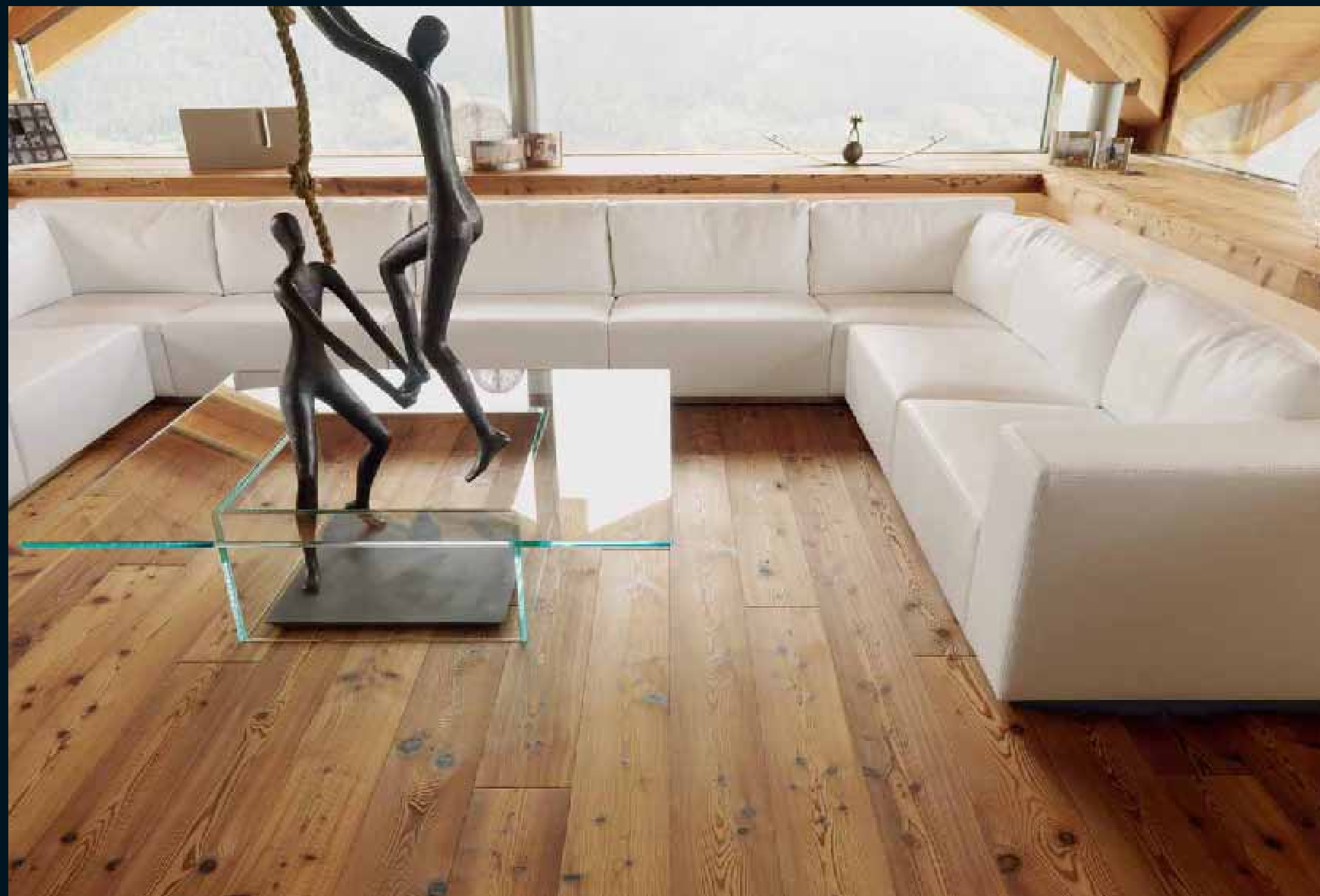
ANTICO LÄRCHE MARRONE / Antico Larch Marrone / Antico Mélèze Marrone / Antico Larice Marrone / Antico Alerce Marrone