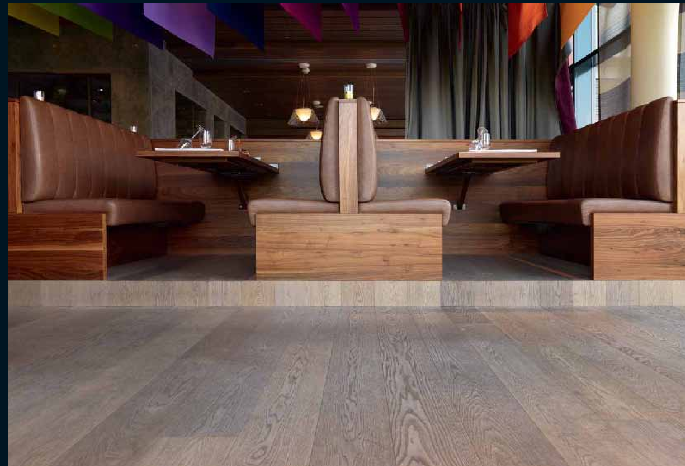
PANEL: AMERIKANISCHE WALNUSS / American Walnut / Noyer U.S. / Noce americano / Nogal Americano FLOOR: