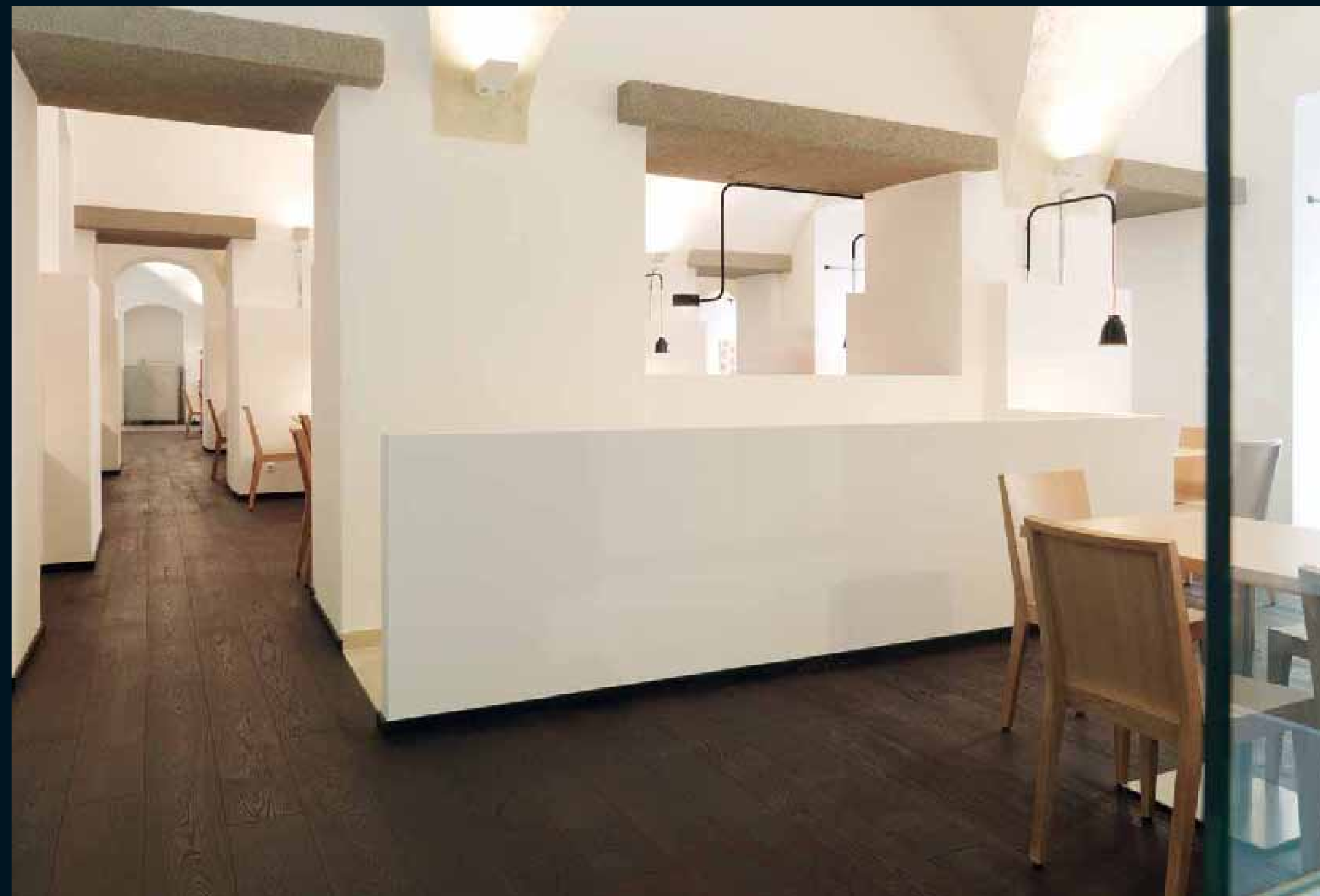
ANTICO EICHE SCURO / Antico Oak Scuro / Antico Chêne Scuro / Antico Rovere Scuro / Antico Roble Scuro