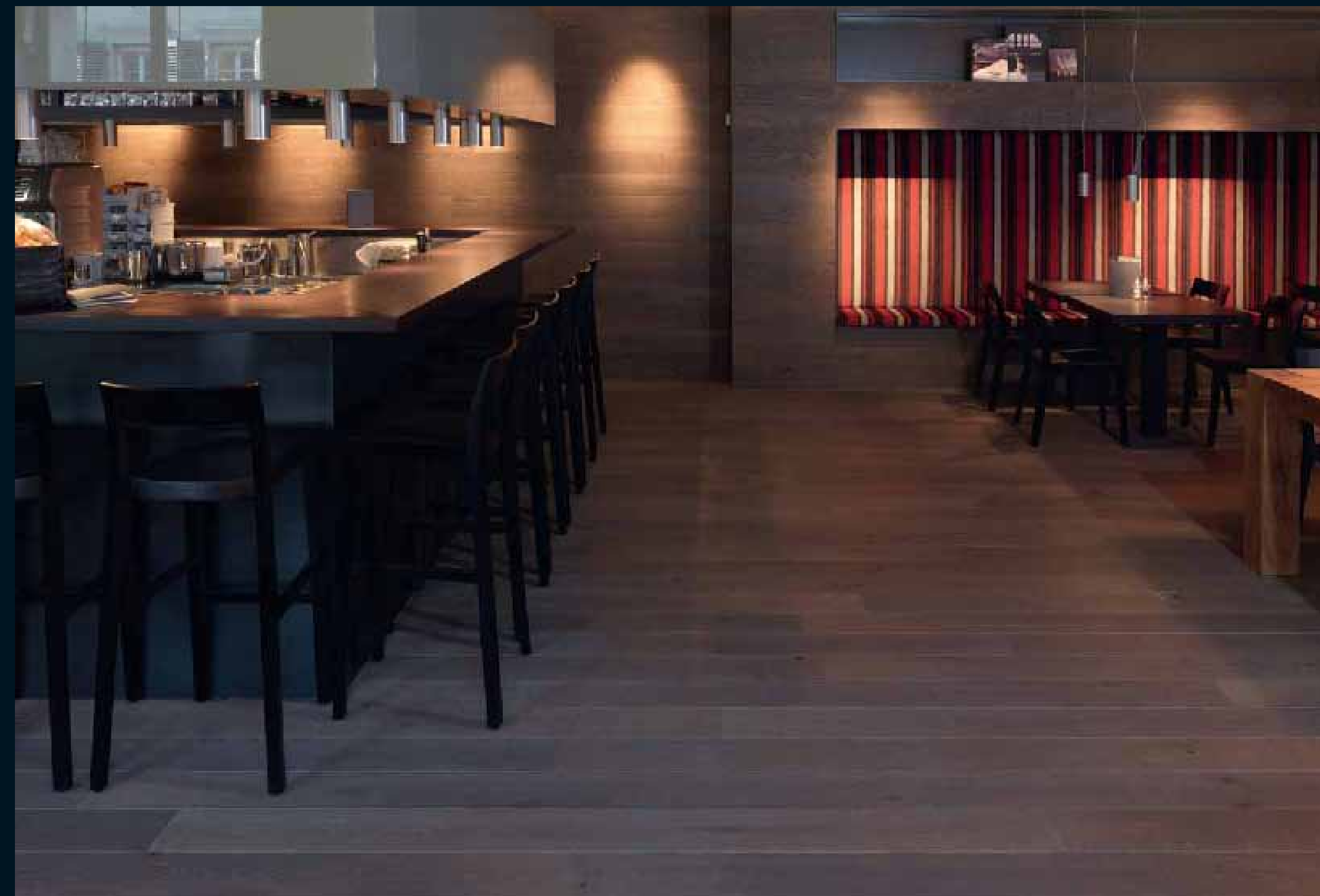
ANTICO EICHE GRIGIO / Antico Oak Grigio / Antico Chêne Grigio / Antico Rovere Grigio / Antico Roble Grigio