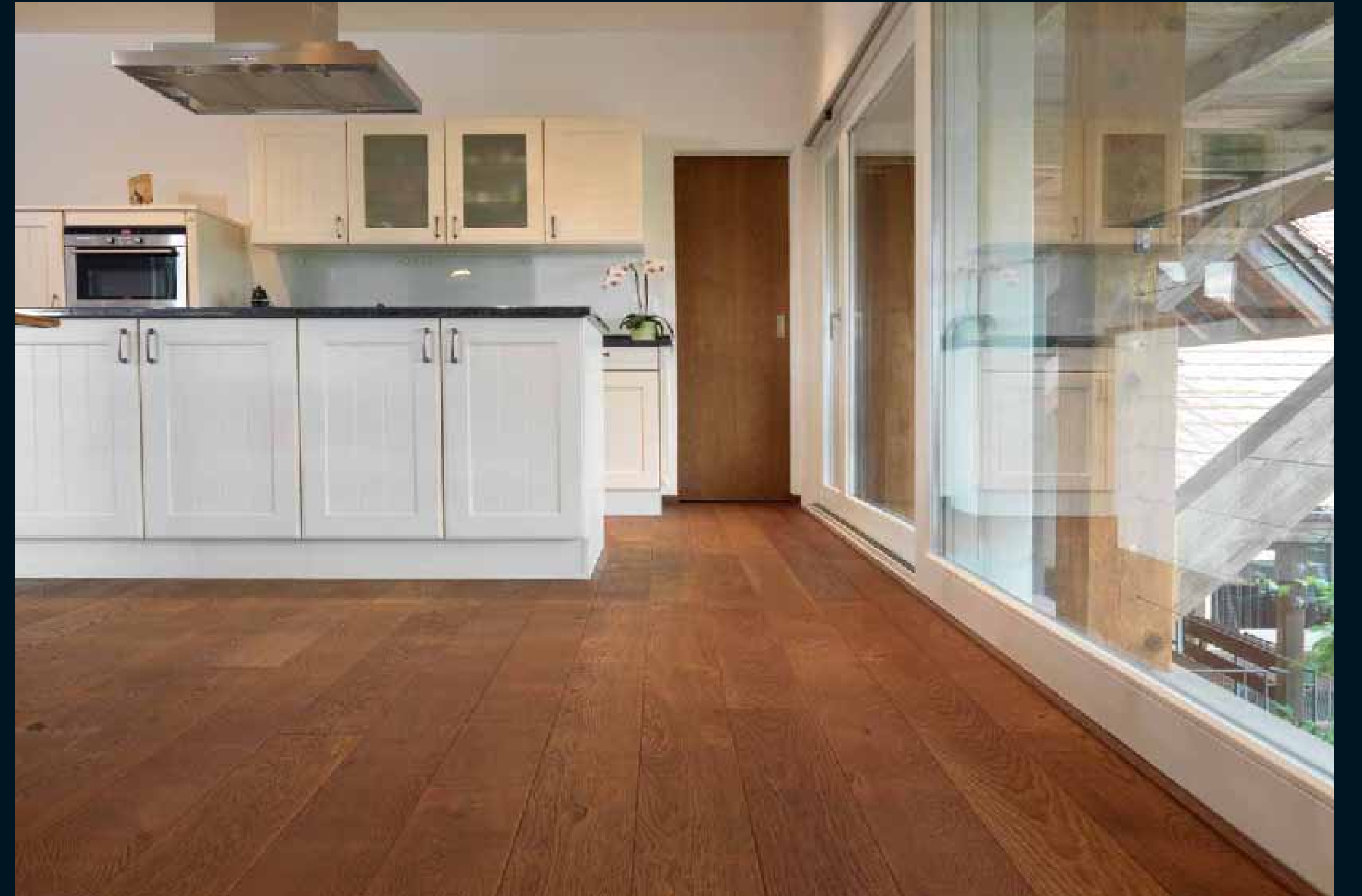
ANTICO EICHE COGNAC / Antico Oak Cognac / Antico Chêne Cognac / Antico Rovere Cognac / Antico Roble Cognac