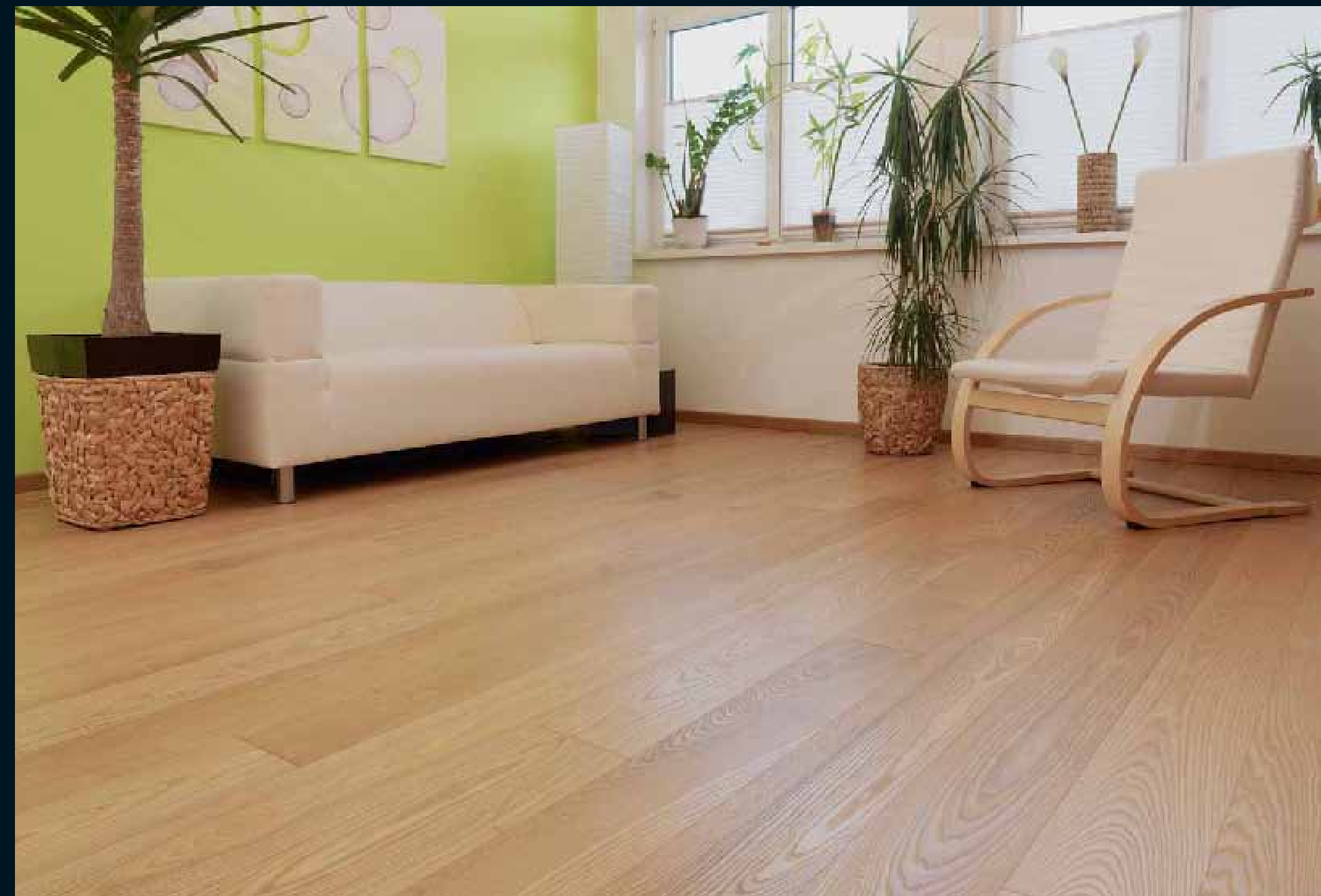
CLASSIC LAUBHOLZ ESCHE HELL / Classic hardwoods Ash light / Classic feuillus Frêne clair / Classic latifoglie Frassino chiaro / Classic frondosas Fresno claro