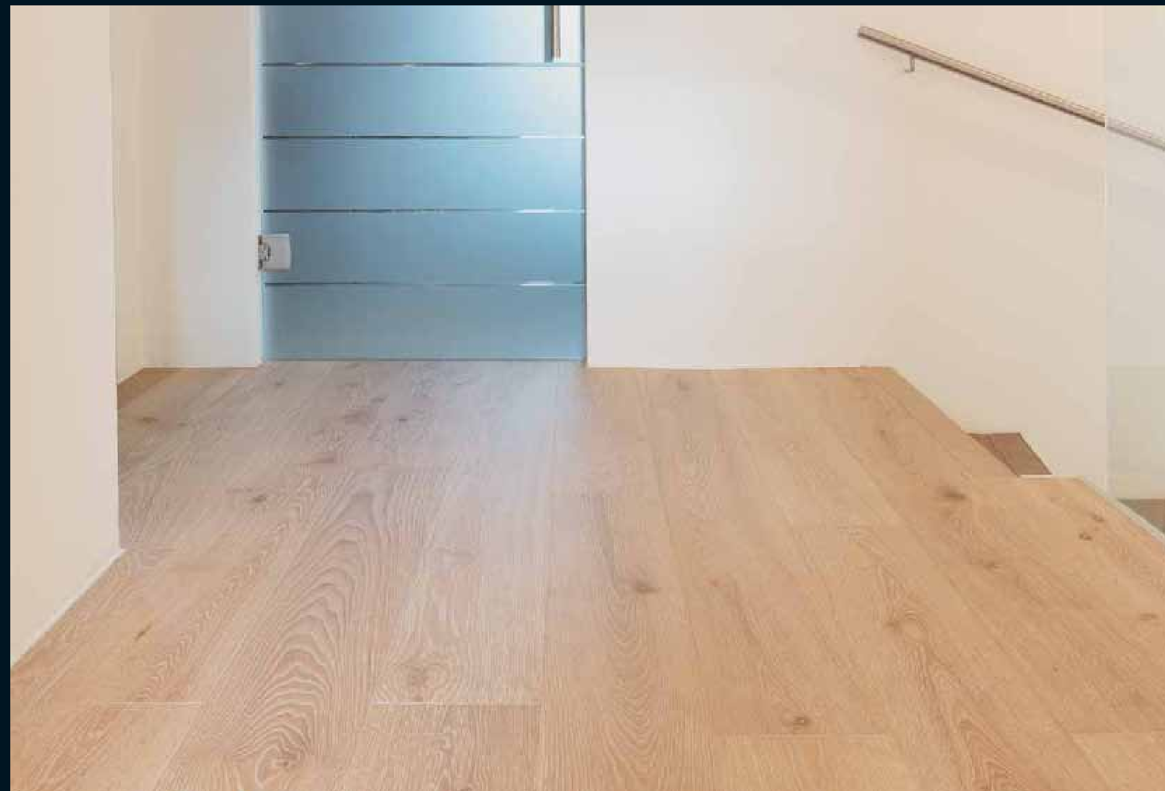
CLASSIC LAUBHOLZ EICHE GEKALKT / Classic hardwoods limed Oak / Classic feuillus Chêne cérusé / Classic latifoglie Rovere sbiancato / Classic frondosas Roble decapado