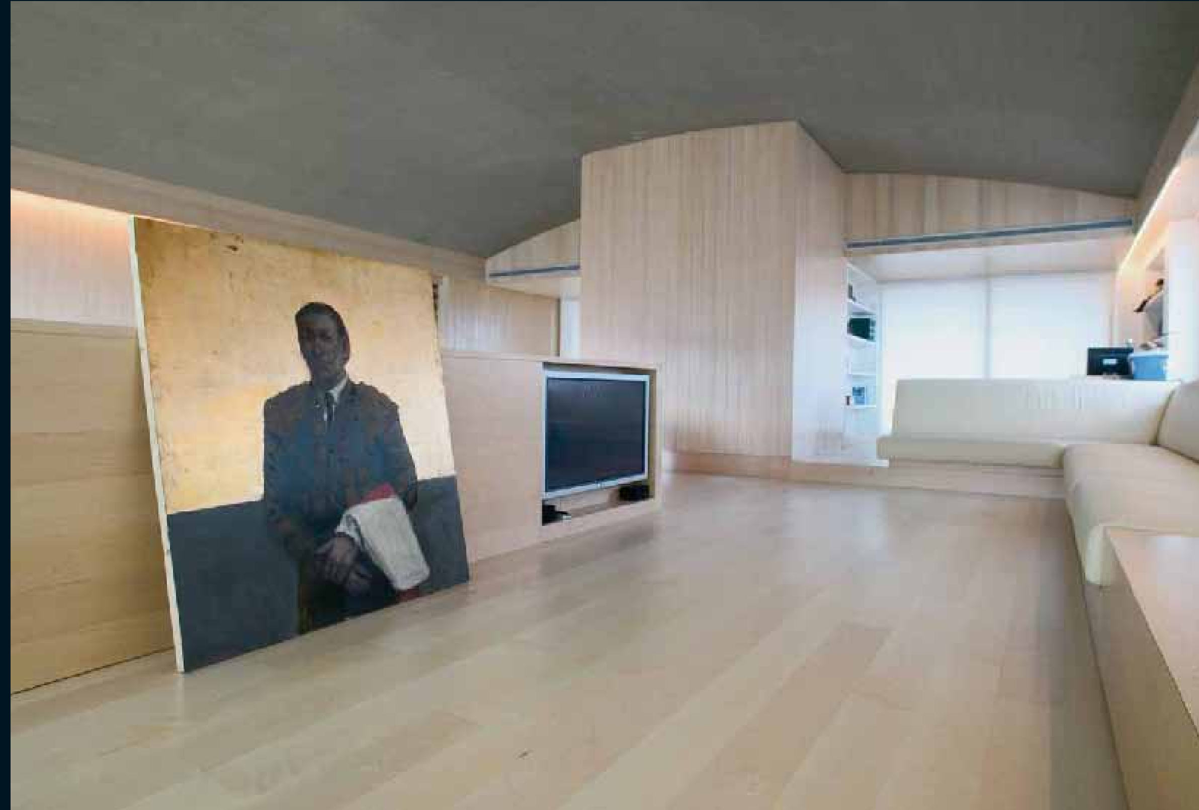
CLASSIC LAUBHOLZ KANADISCHE AHORN / Classic hardwoods Can. Maple / Classic feuillus Erable can. / Classic latifoglie Acero can. / Classic frondosas Arce Can.