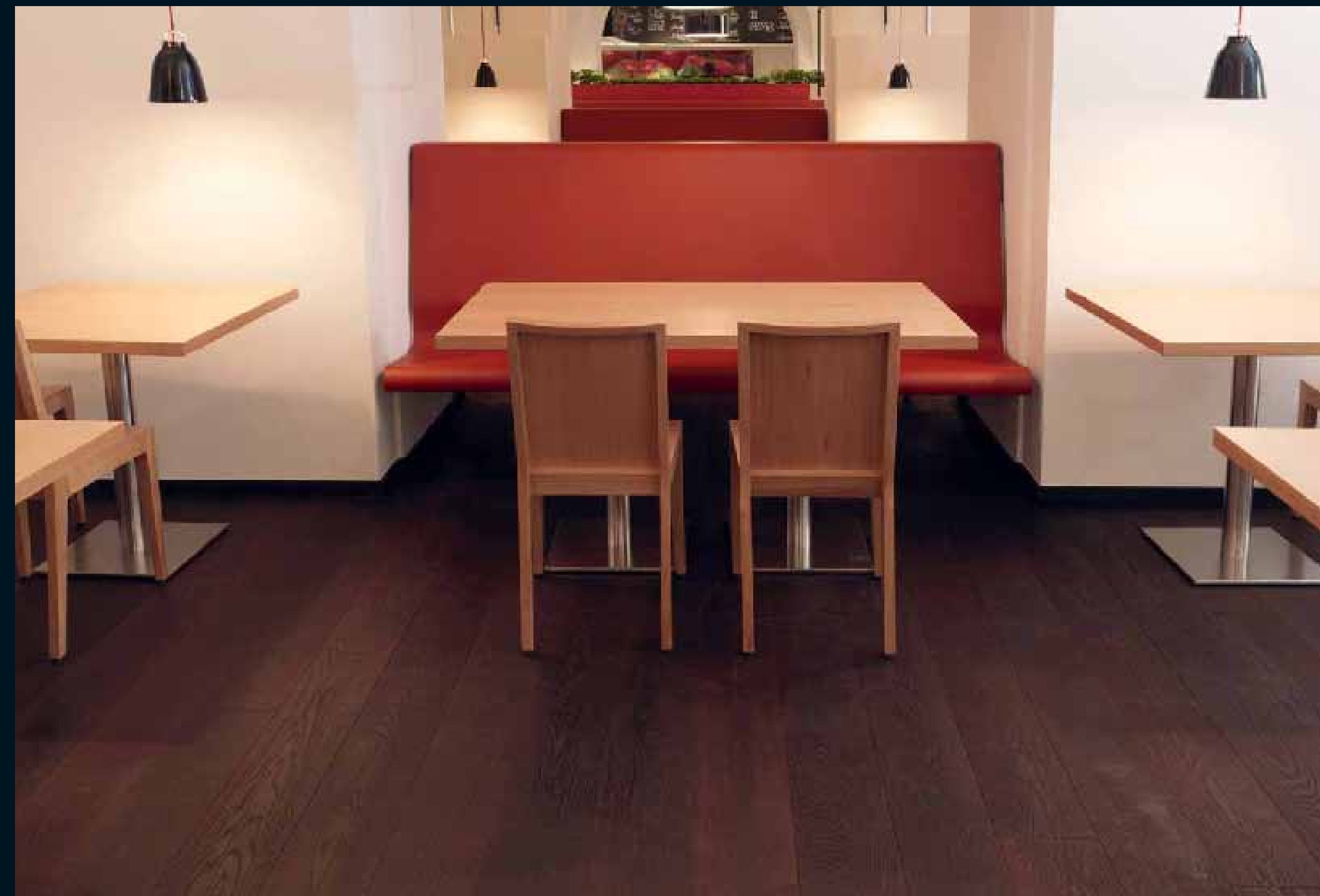
ANTICO EICHE SCURO / Antico Oak Scuro / Antico Chêne Scuro / Antico Rovere Scuro / Antico Roble Scuro