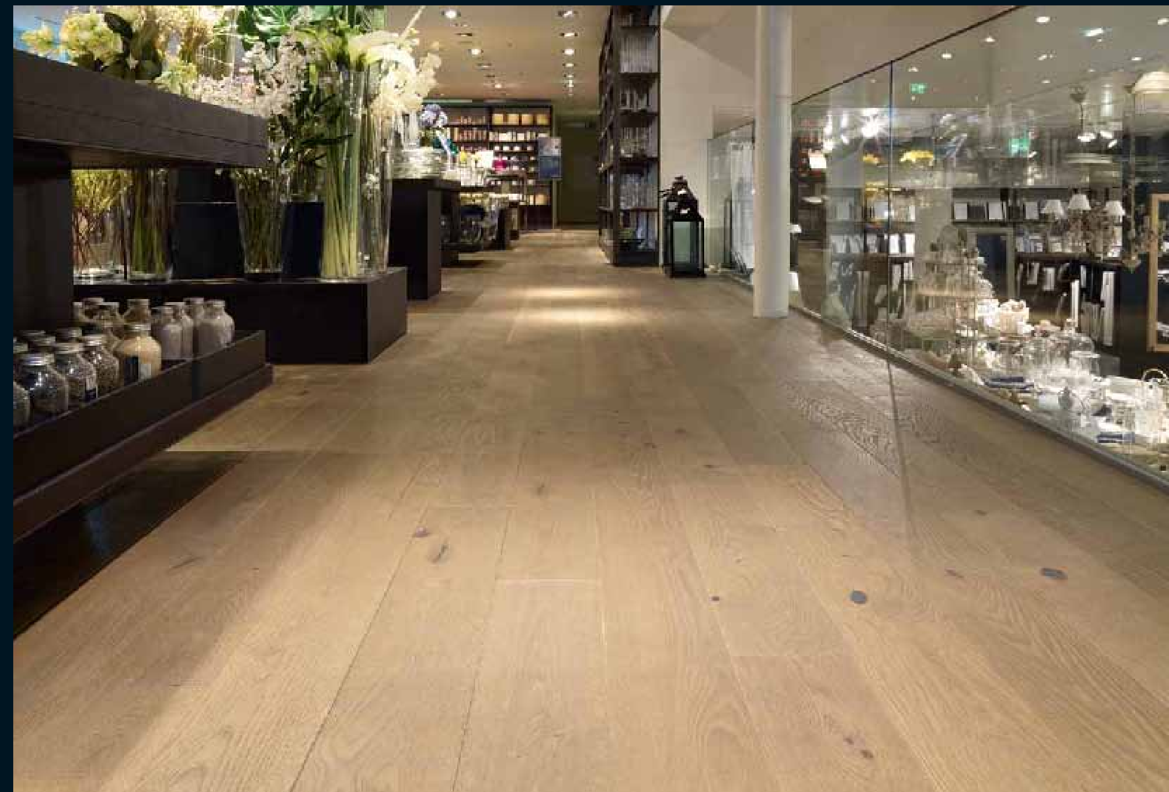
ANTICO EICHE GRIGIO / Antico Oak Grigio / Antico Chêne Grigio / Antico Rovere Grigio / Antico Roble Grigio