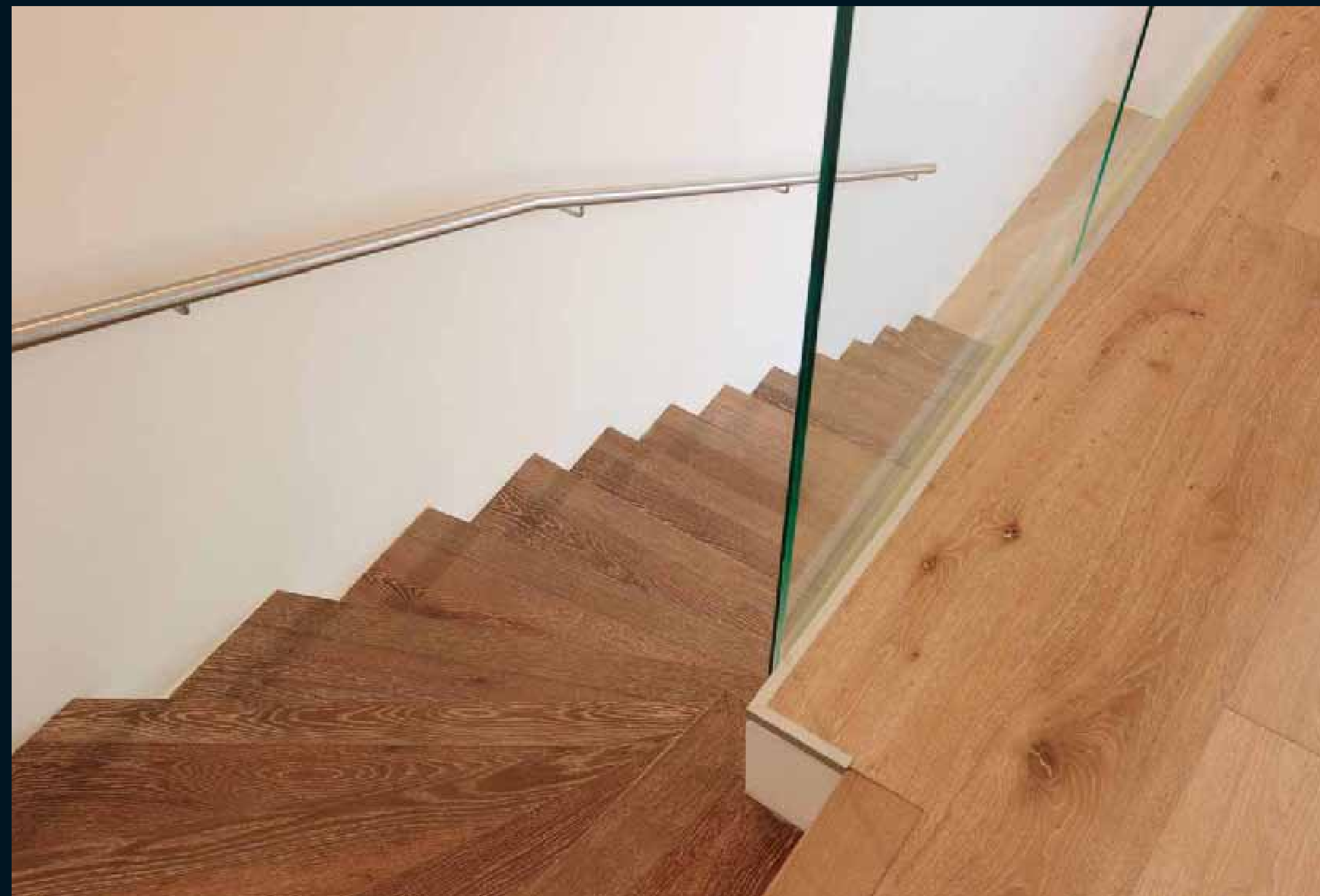
MOCCA EICHE MEDIUM GEKALKT / Mocca limed Oak medium / Mocca Chêne medium cérusé / Mocca Rovere miele sbiancato / Mocca Roble medium decapado