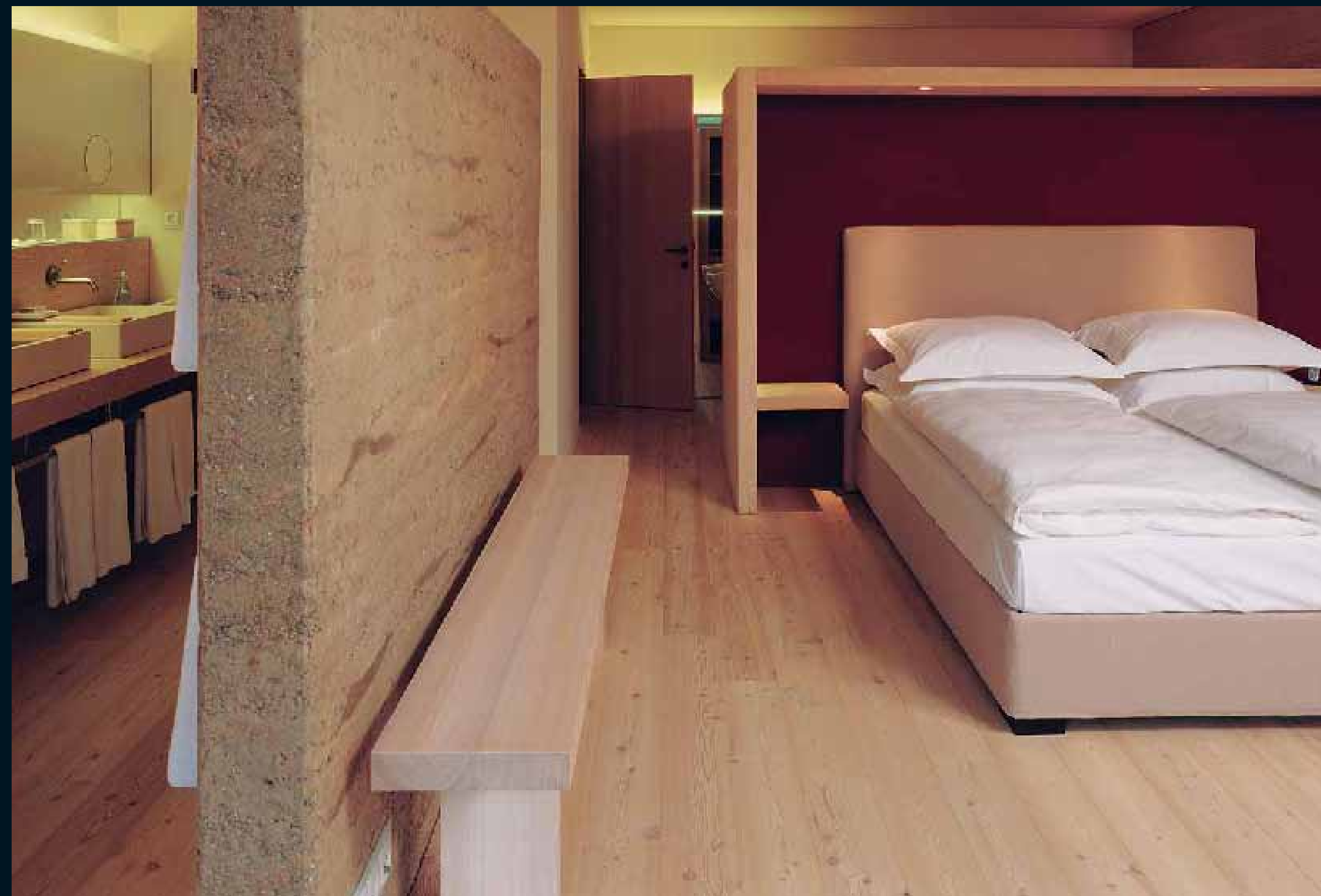
CLASSIC NADELHOLZ SIBIRISCHE LÄRCHE / Classic softwoods sib. Larch / Classic résineux Mélèze sib. / Classic conifere Larice sib. / Classic coniferas Alerce Sib.