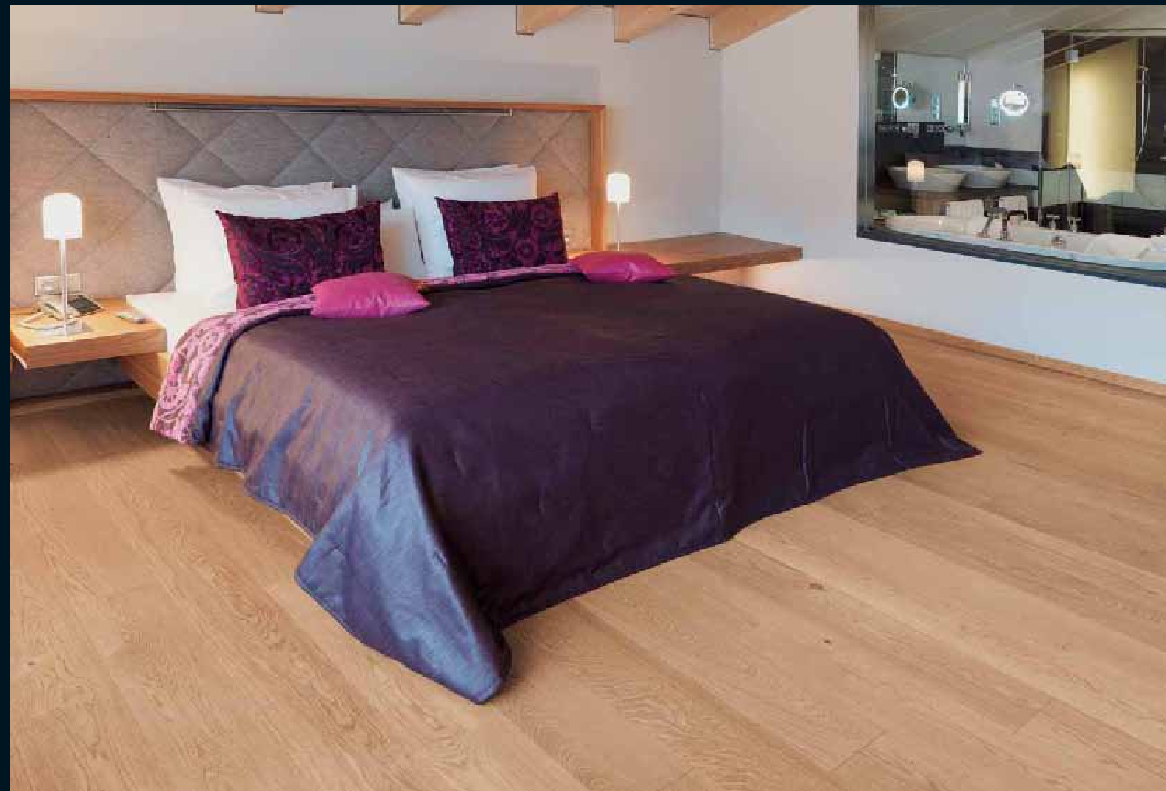
CLASSIC LAUBHOLZ EICHE / Classic hardwoods Oak / Classic feuillus Chêne / Classic latifoglie Rovere / Classic frondosas Roble