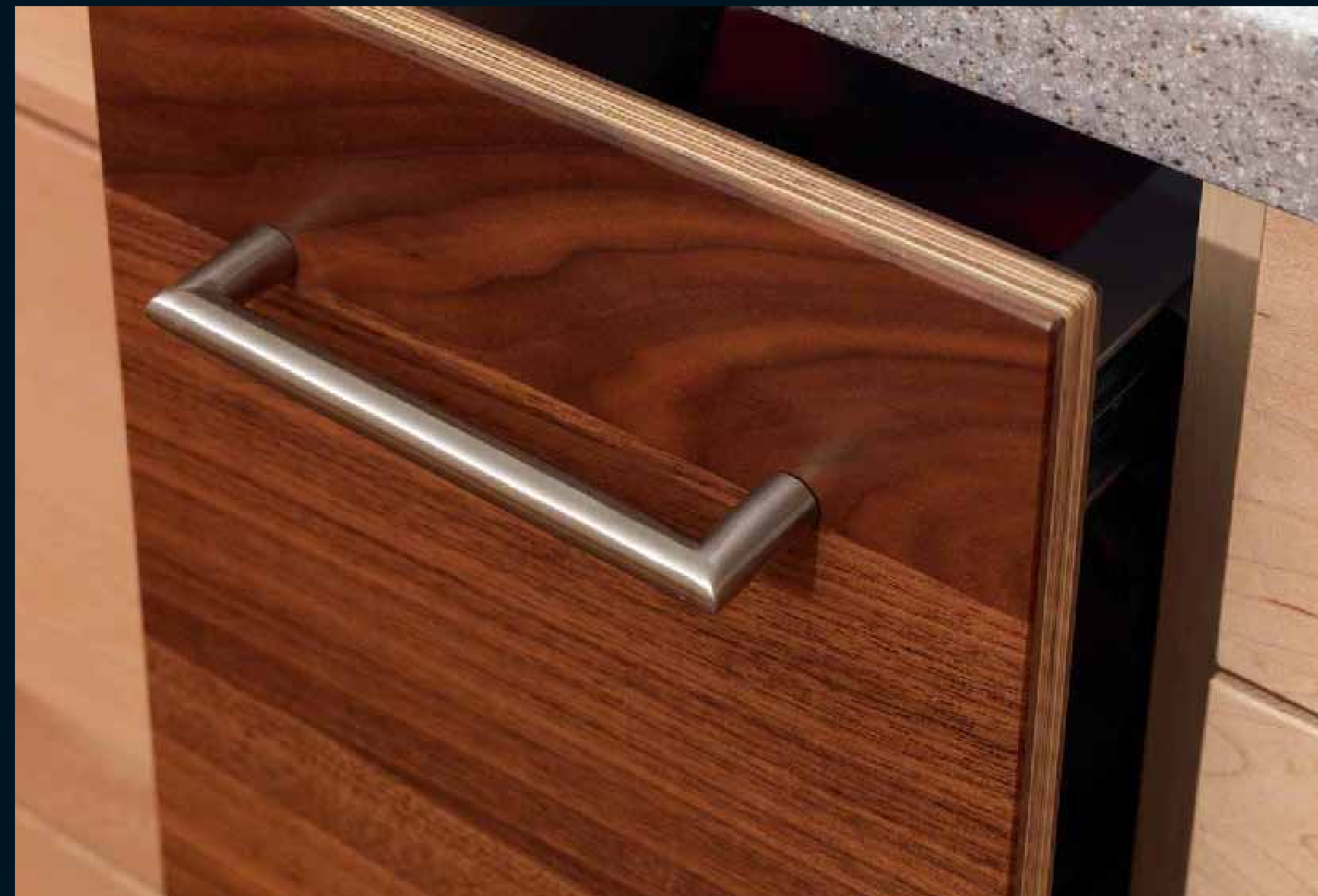
PANEL: AMERIKANISCH WALNUSS / American Walnut / Noyer U.S. / Noce americano / Nogal Americano