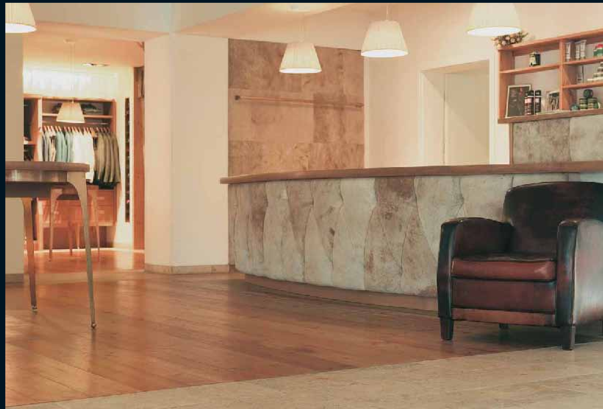
ALTHOLZ FICHTE / Reclaimed Wood Spruce / Vieux Bois Epicéa / Abete legno vecchio / Madera ENV. Abeto