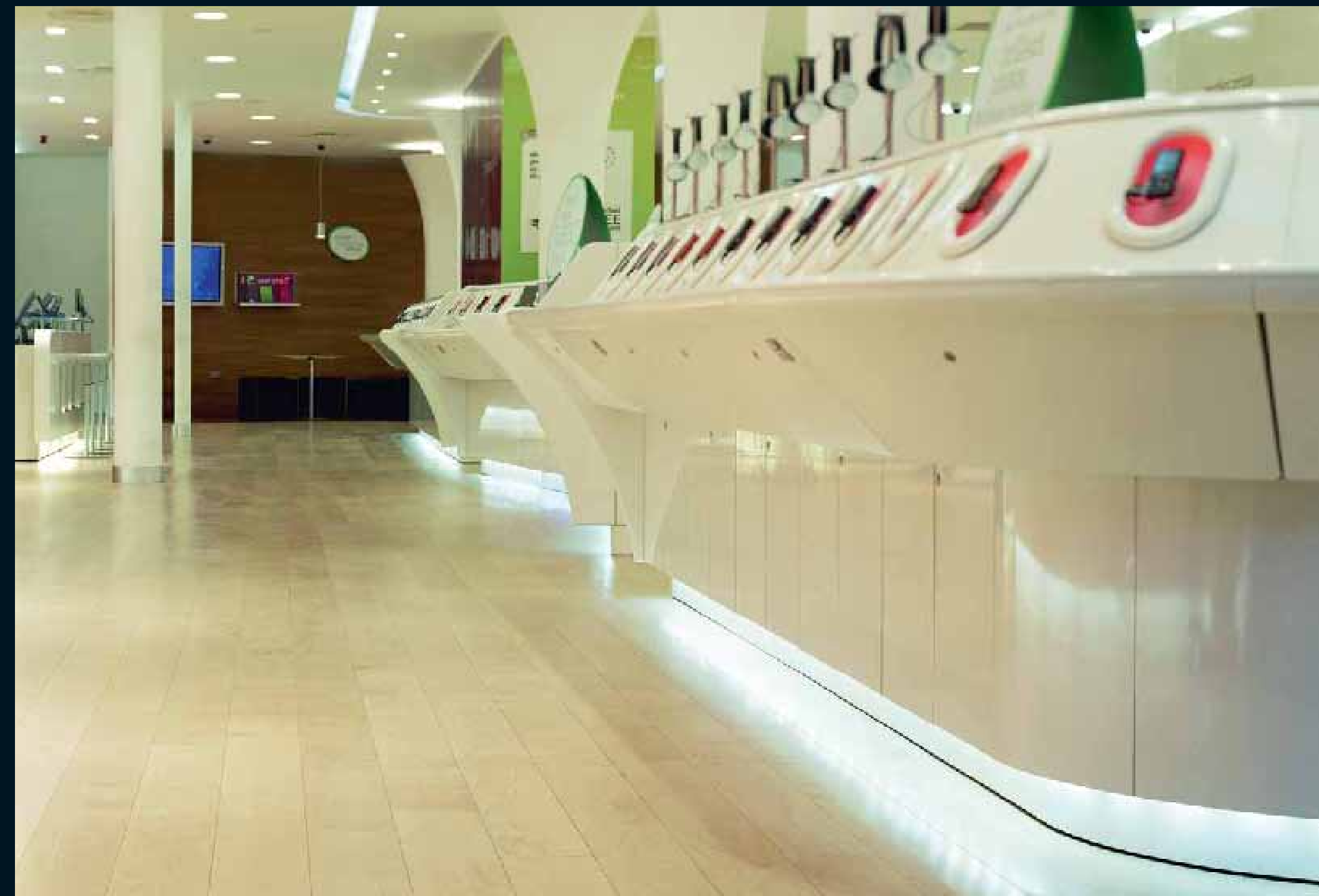
CLASSIC LAUBHOLZ KANADISCHE AHORN / Classic hardwoods can. Maple / Classic feuillus Erable can. / Classic latifoglie Acero can. / Classic frondosas Arce Can.