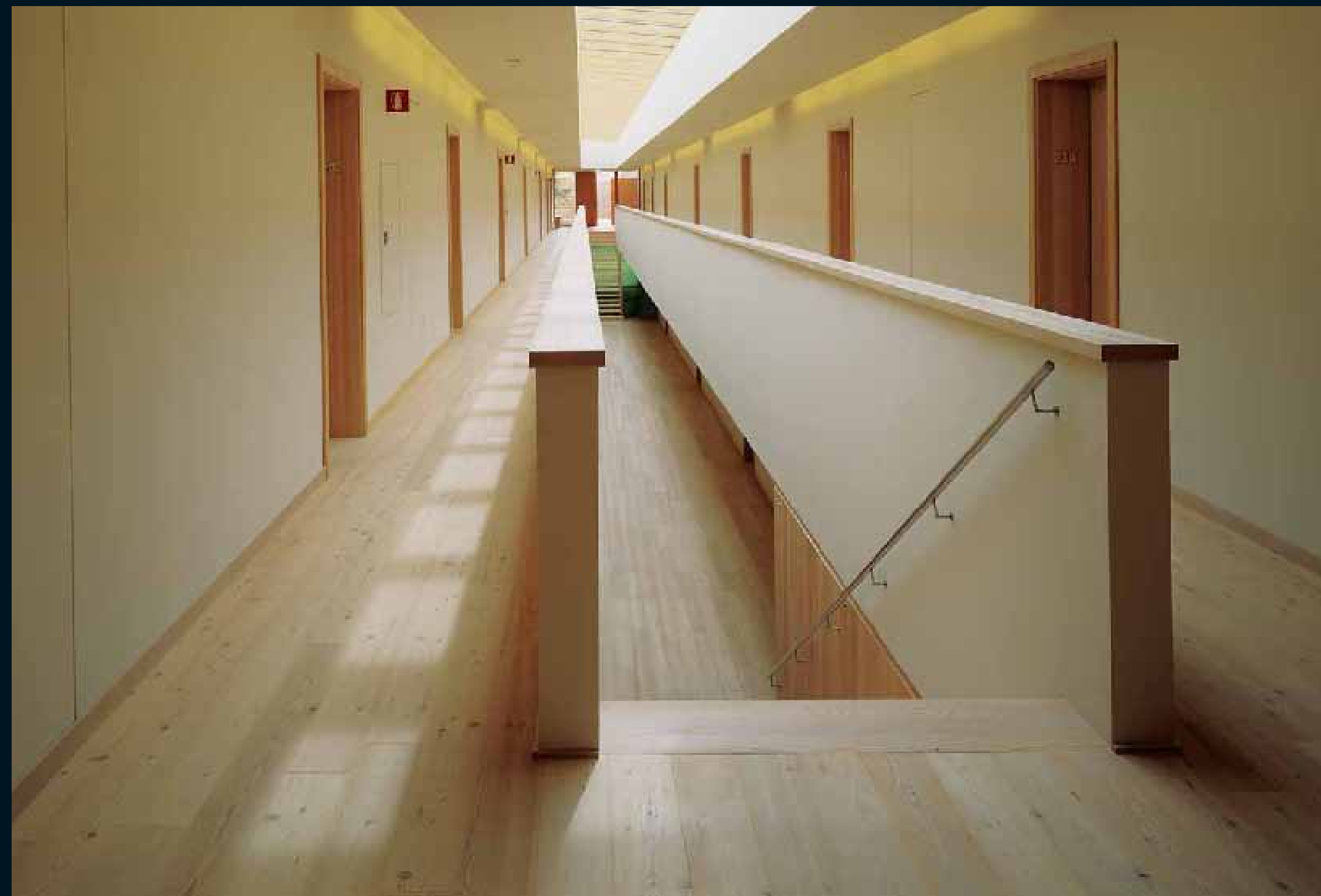
CLASSIC NADELHOLZ SIB. LÄRCHE / Classic softwoods sib. Larch / Classic résineux Mélèze sib. / Classic conifere Larice sib. / Classic coníferas Alerce Sib.