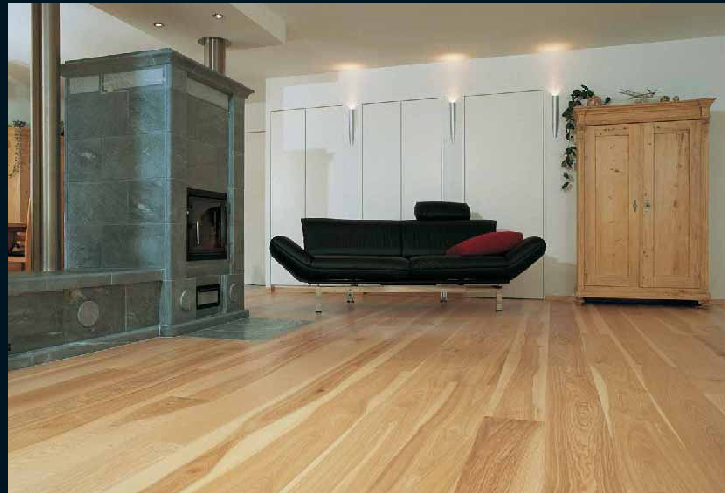
CLASSIC LAUBHOLZ ESCHE OLIV / Classic hardwoods Ash olive / Classic feuillus Frêne olivier / Classic latifoglie Frassino olivato / Classic frondosas Fresno olivo