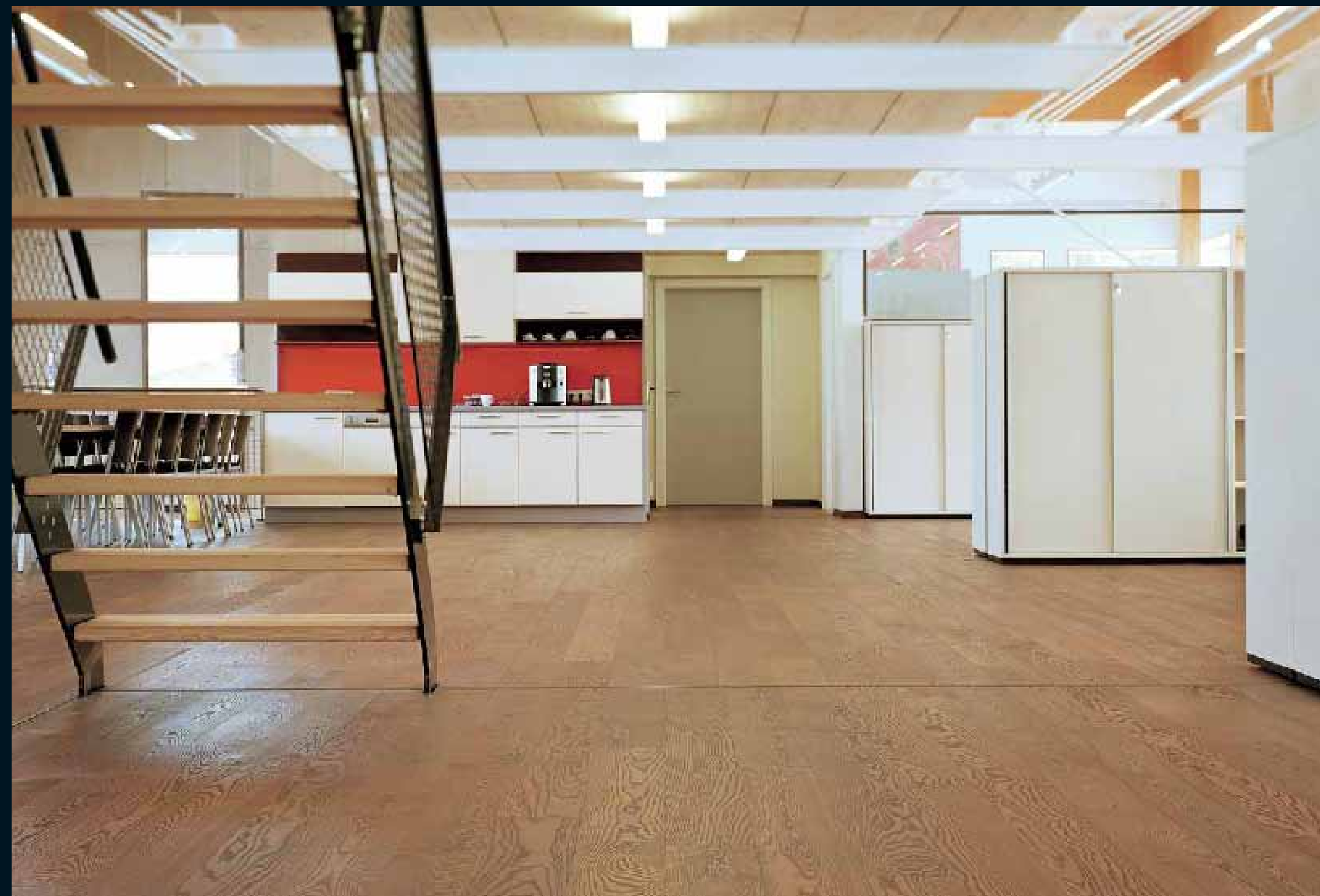
MOCCA ESCHE DUNKEL / Mocca Ash dark / Mocca Frêne foncé / Mocca Frassino scuro / Mocca Fresno dark