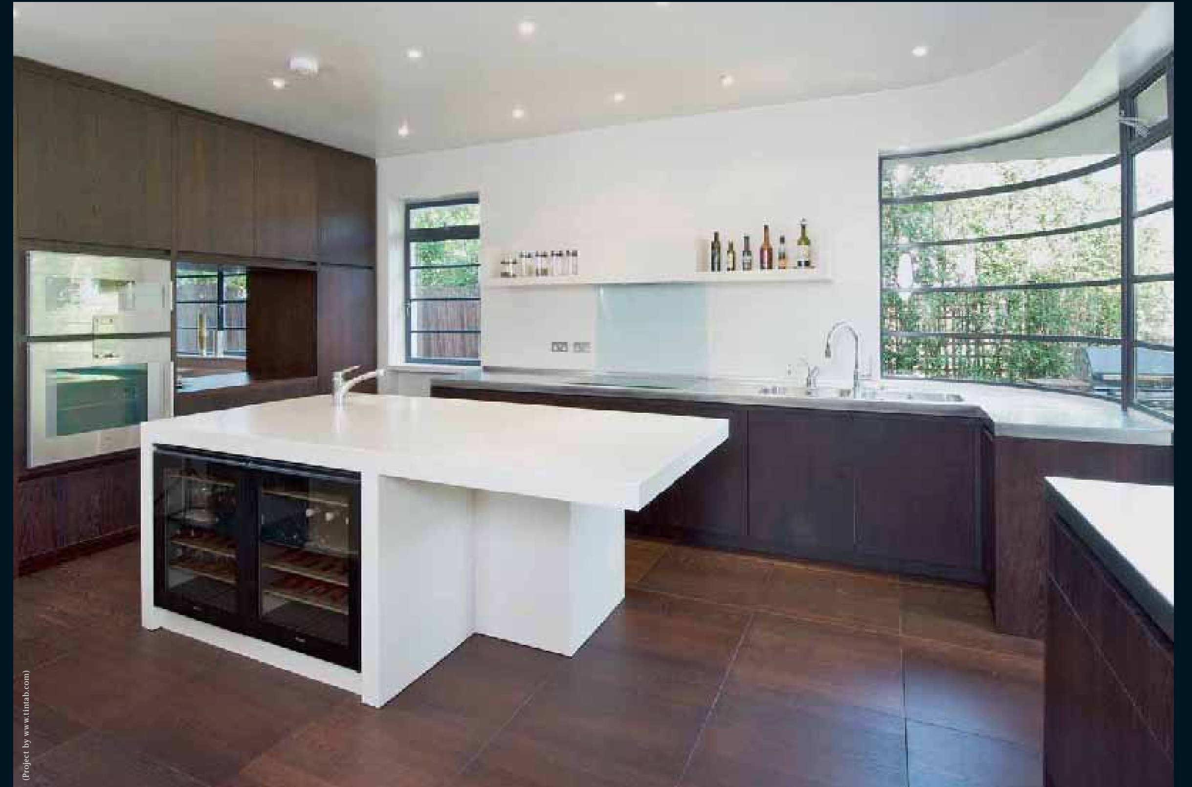
PANEL: MOCCA EICHE DUNKEL / Mocca Oak dark / Mocca Chêne foncé / Mocca Rovere scuro / Mocca Roble dark