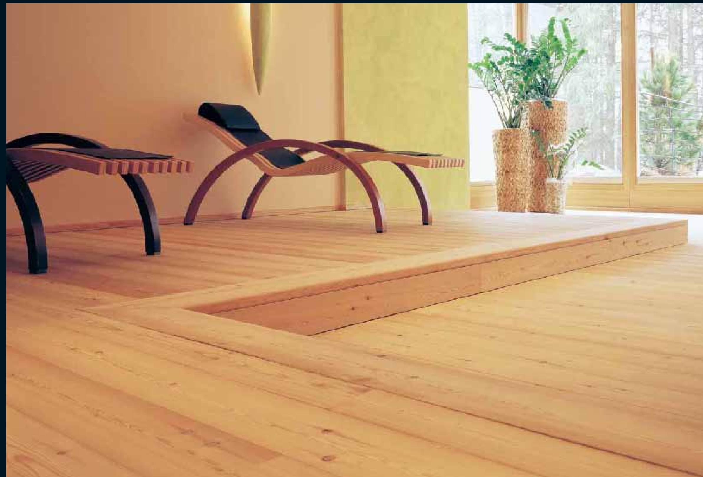
CLASSIC NADELHOLZ SIB. LÄRCHEN / Classic softwoods sib. Larch / Classic résineux Mélèze sib. / Classic conifere Larice sib. / Classic coniferas Alerce Sib.