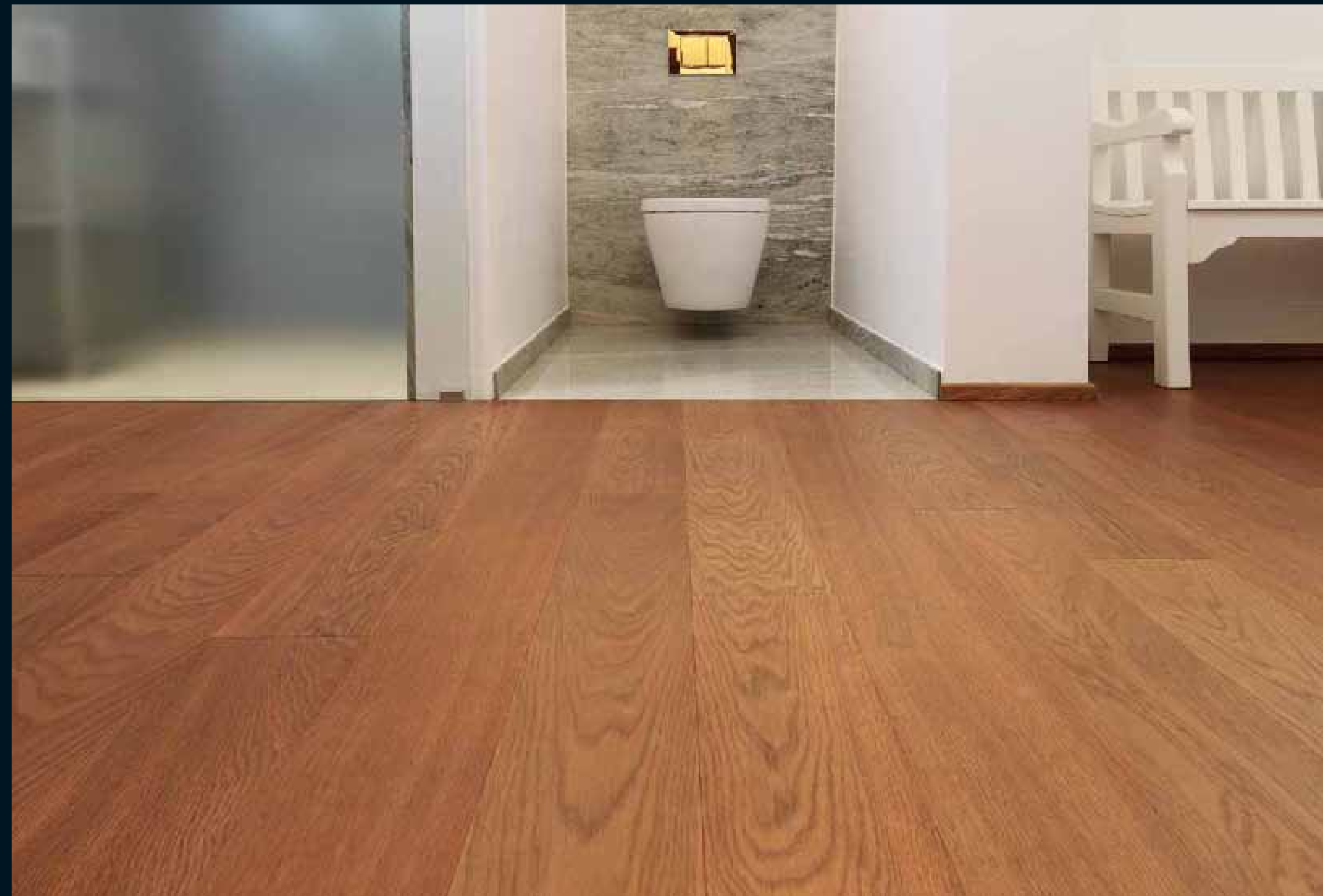
MOCCA EICHE MEDIUM / Mocca Oak medium / Mocca Chêne medium / Mocca Rovere miele / Mocca Roble medium