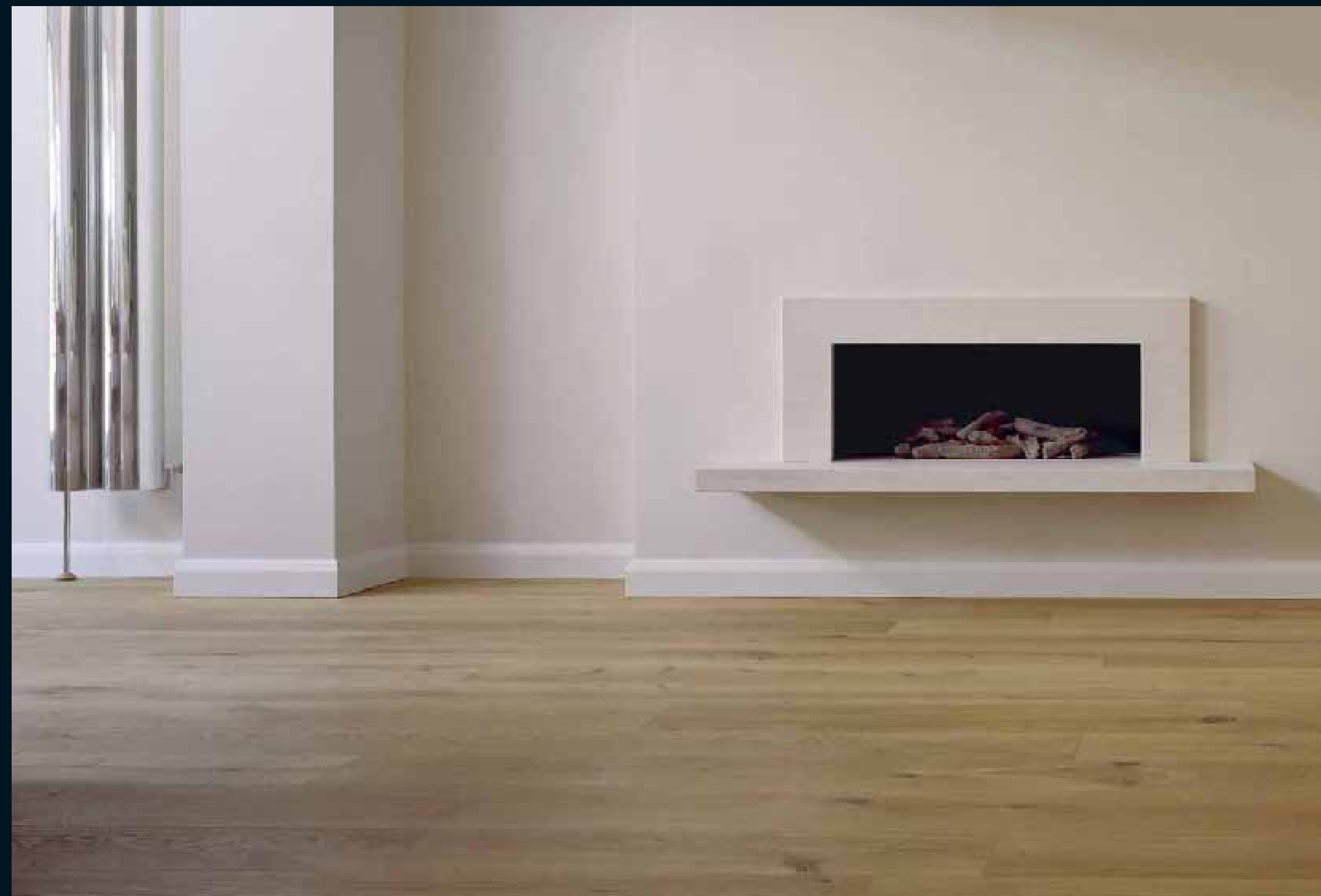
CLASSIC LAUBHOLZ EICHE / Classic hardwoods Oak / Classic feuillus Chêne / Classic latifoglie Rovere / Classic frondosas Roble