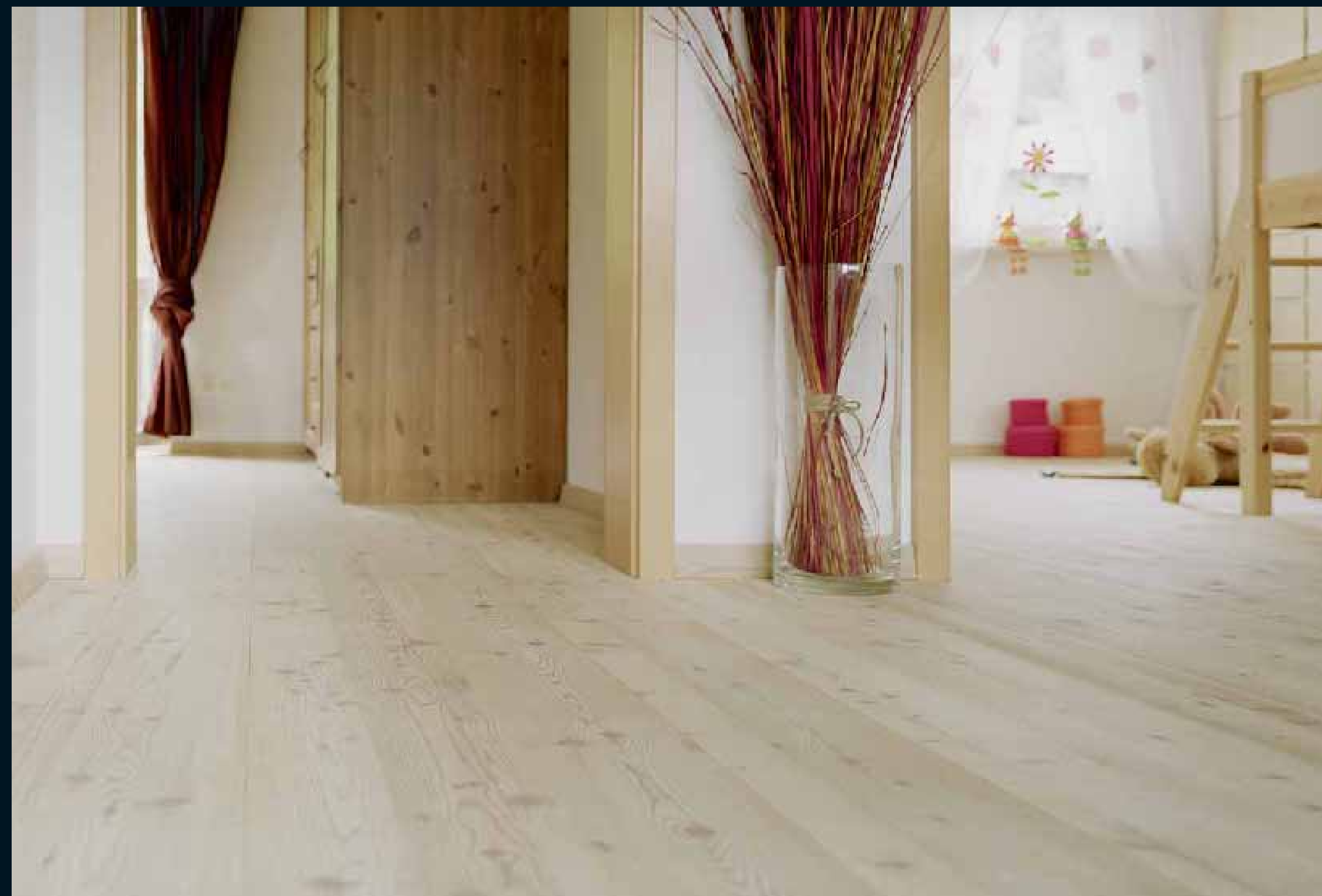
CLASSIC NADELHOLZ LÄRCHE GELAUGT / Classic softwoods Larch lye-washed / Classic résineux Mélèze lessivé / Classic conifere Larice trattato a soda / Classic coniferas Alerce decapado