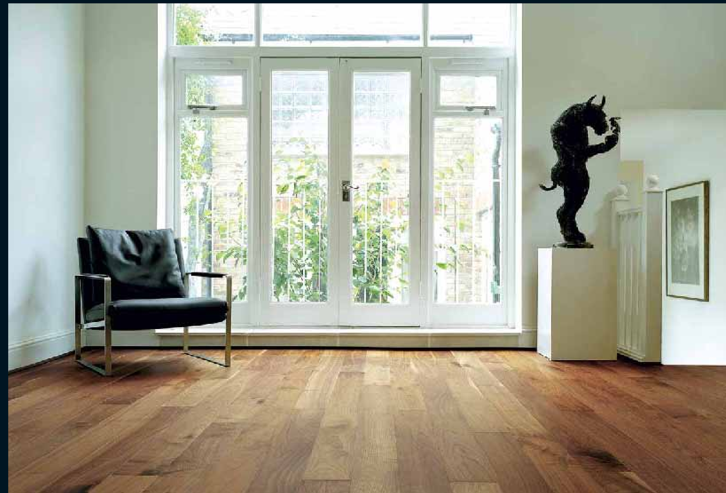
CLASSIC LAUBHOLZ AMERIKANSICHE WALNUSS / Classic hardwoods Americ. Walnut / Classic feuillus Noyer U.S. / Classic latifoglie Noce americ. / Classic frondosas Nogal Americ.