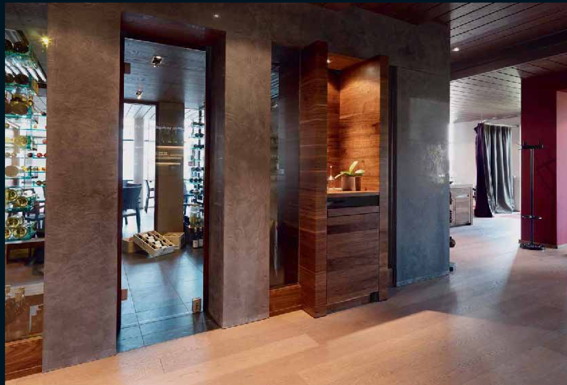
FLOOR: ANTICO EICHE SCURO / Antico oak scuro / Antico oak scuro / Antico oak scuro / Antico oak scuro PANEL: ANTICO EICHE SCURO / Antico oak scuro / Antico oak scuro / Antico oak scuro / Antico oak scuro