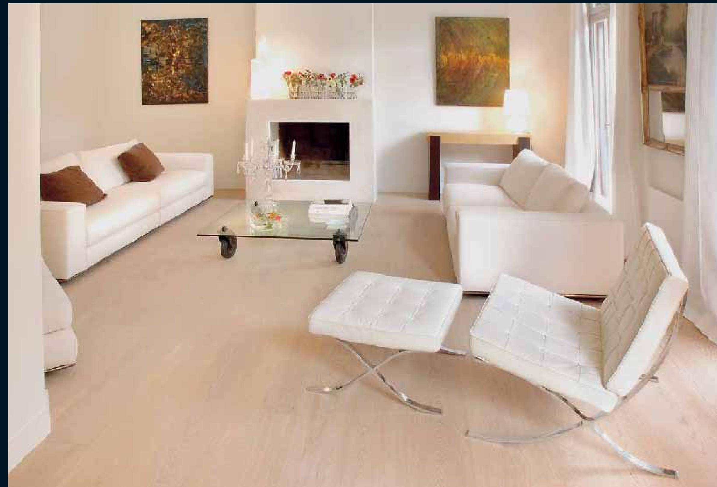
CLASSIC LAUBHOLZ EICHE / Classic hardwoods Oak / Classic feuillus Chêne / Classic latifoglie Rovere / Classic frondosas Roble