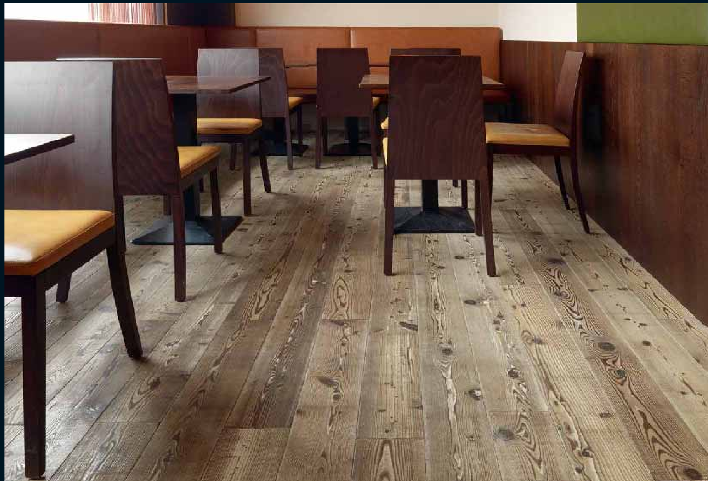
ANTICO LÄRCHE GRIGIO / Antico Larch Grigio / Antico Mélèze Grigio / Antico Larice Grigio / Antico Alerce Grigio