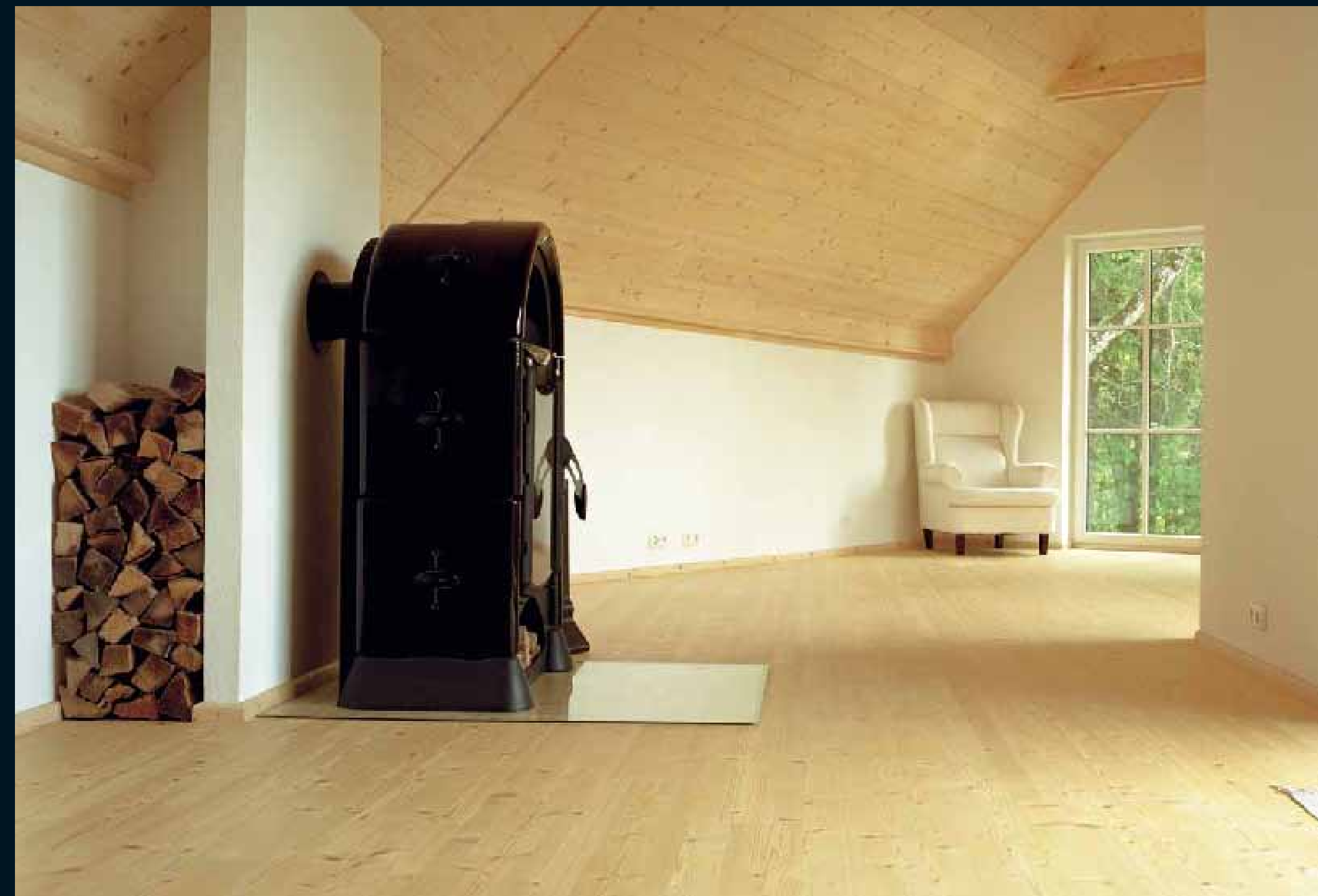
CLASSIC NADELHOLZ FICHTE / Classic softwoods Spruce / Classic résineux Epicéa / Classic conifere Abete / Classic coniferas Abeto