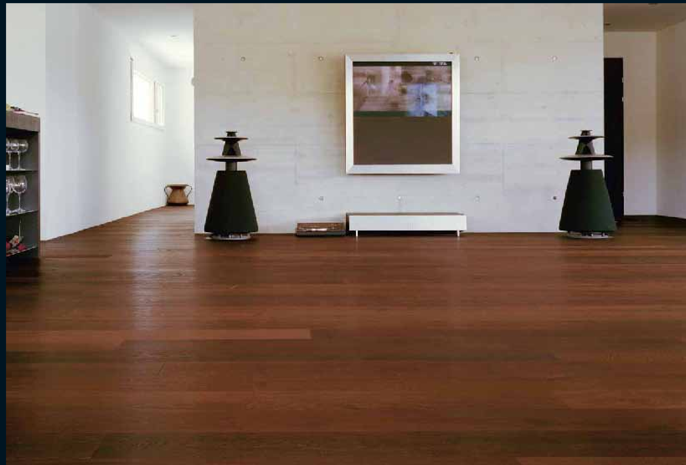
MOCCA EICHE DUNKEL / MOCCA Oak dark / Mocca Chêne foncé / Mocca Rovere scuro / Mocca Roble dark