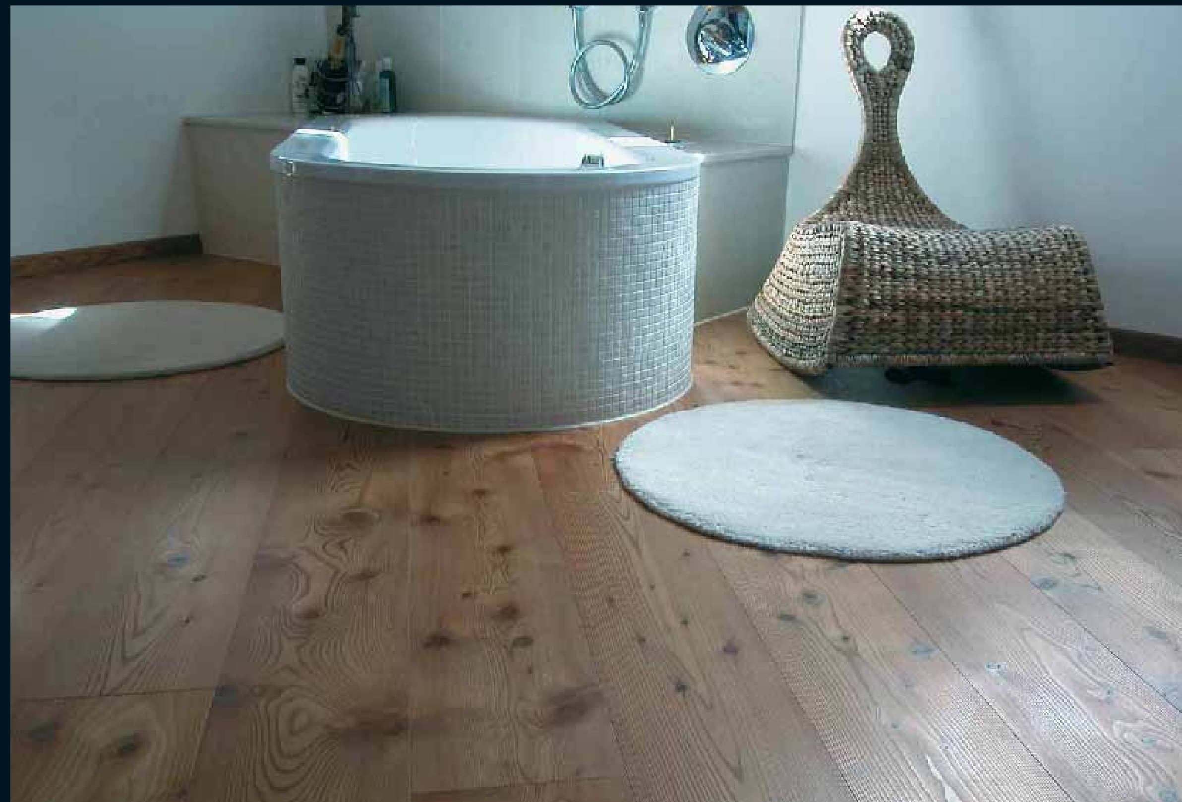
CLASSIC NADELHOLZ LÄRCHE ALT / Classic softwoods Larch AGED / Classic résineux Mélèze à l'anc. / Classic conifere Larice INV. / Classic coniferas Alerce ENV.