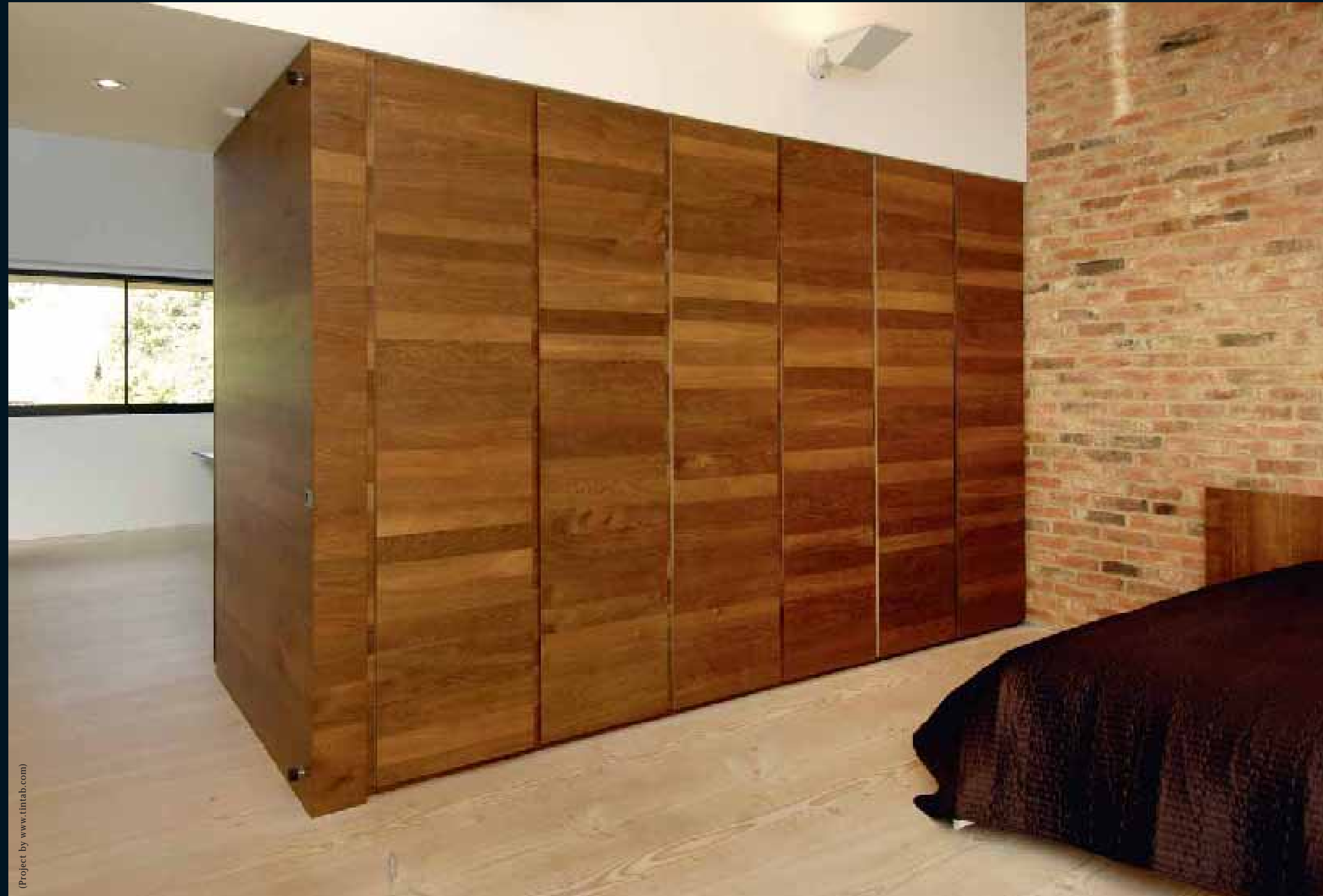
FLOOR: CLASSIC NADELHOLZ LÄRCHE SIBIRISCH / Classic softwoods sib. Larch / Classic résineux Mélèze sib. / Classic conifere Larice sib. / Classic coniferas Alerce Sib. PANEL: MOCCA EICHE MEDIUM / Mocca Oak medium / Mocca Chêne médium / Mocca Rovere miele / Mocca Roble médium