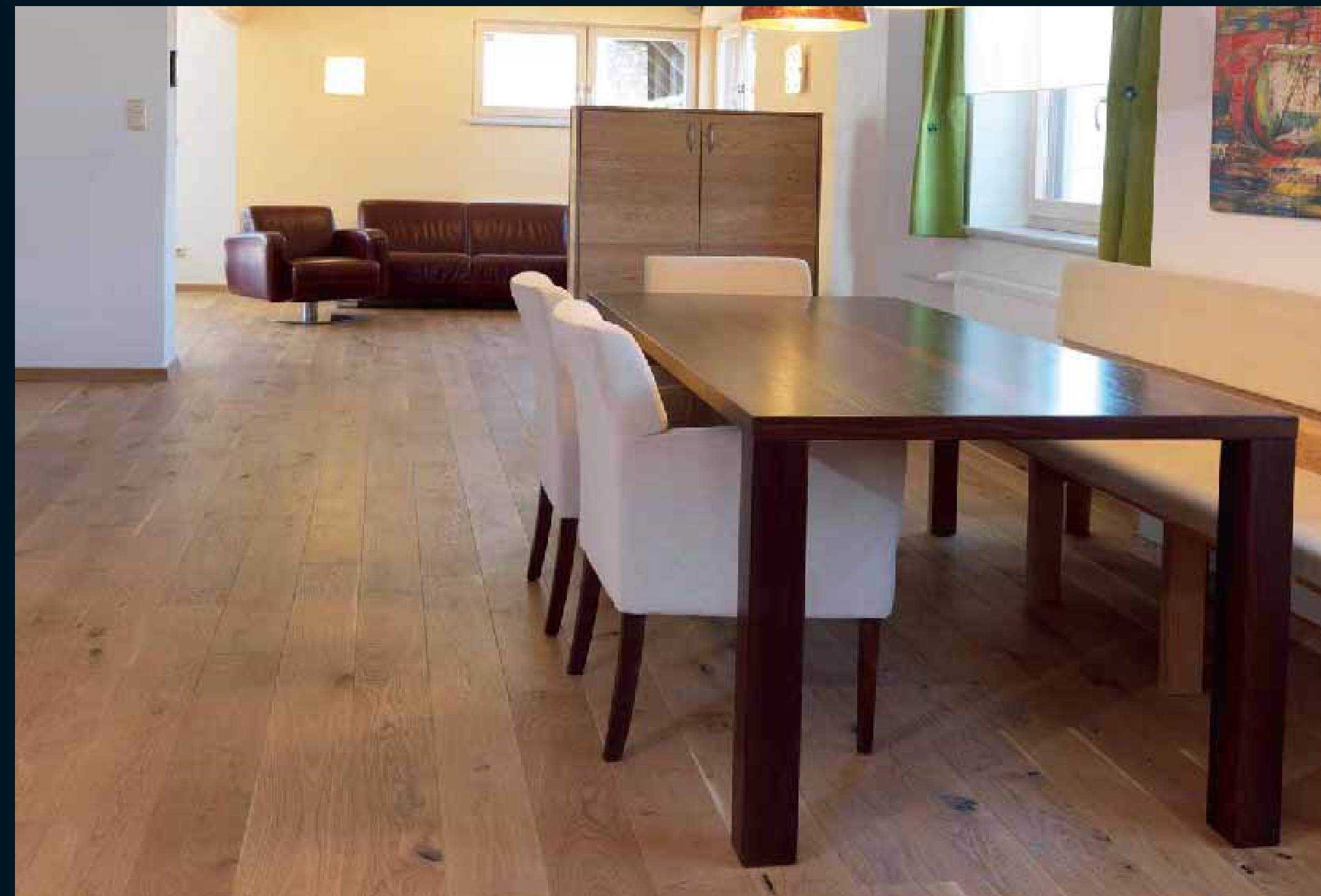
JOHANN EICHE RUSTIKAL / Johann oak rustic / Johann chêne rustique / Johann rovere rustico / Johann roble „rustico“