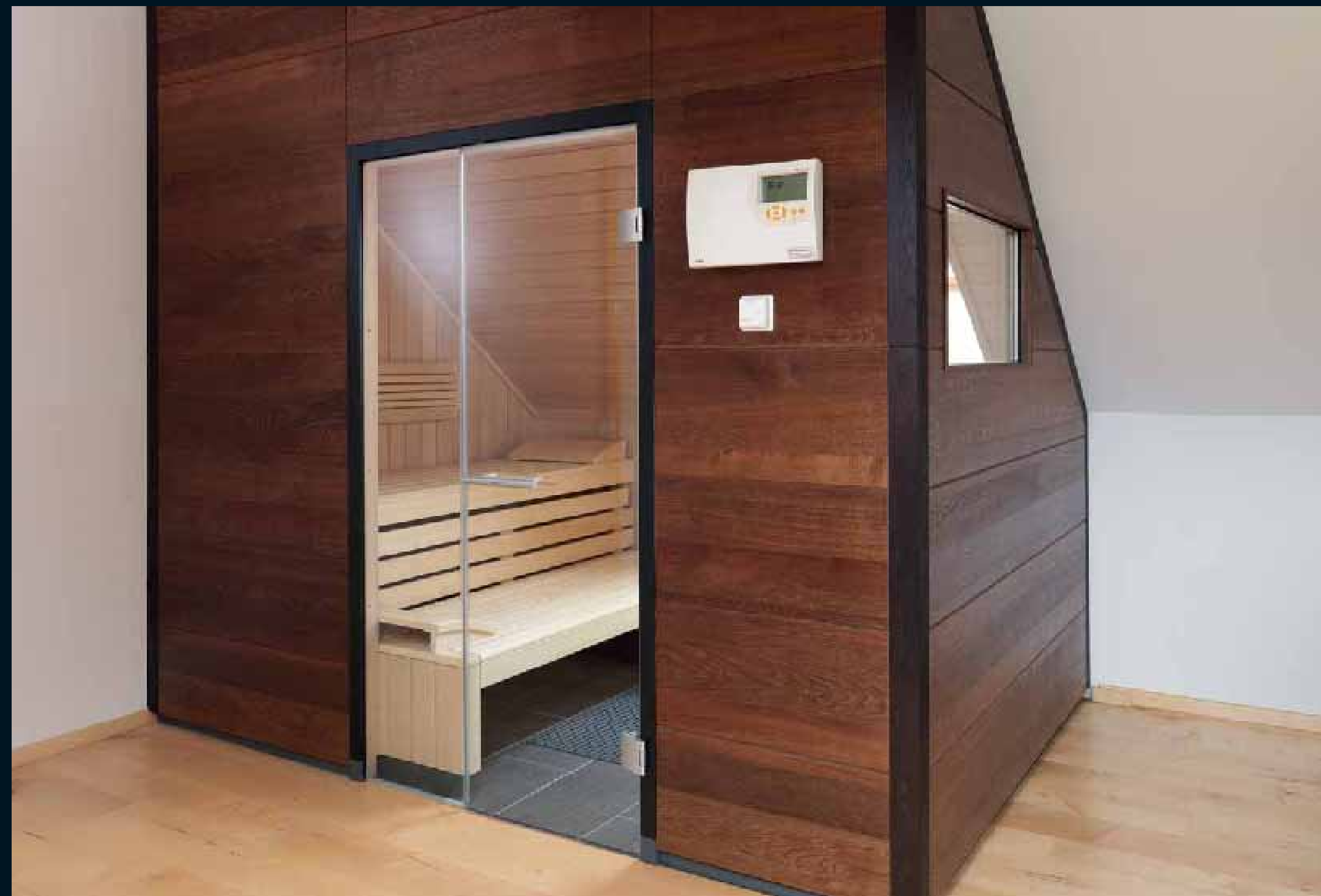
PANEL: MOCCA ESCHE DUNKEL / Mocca Ash dark / Mocca Frêne foncé / Mocca Frassino scuro / Mocca Fresno dark