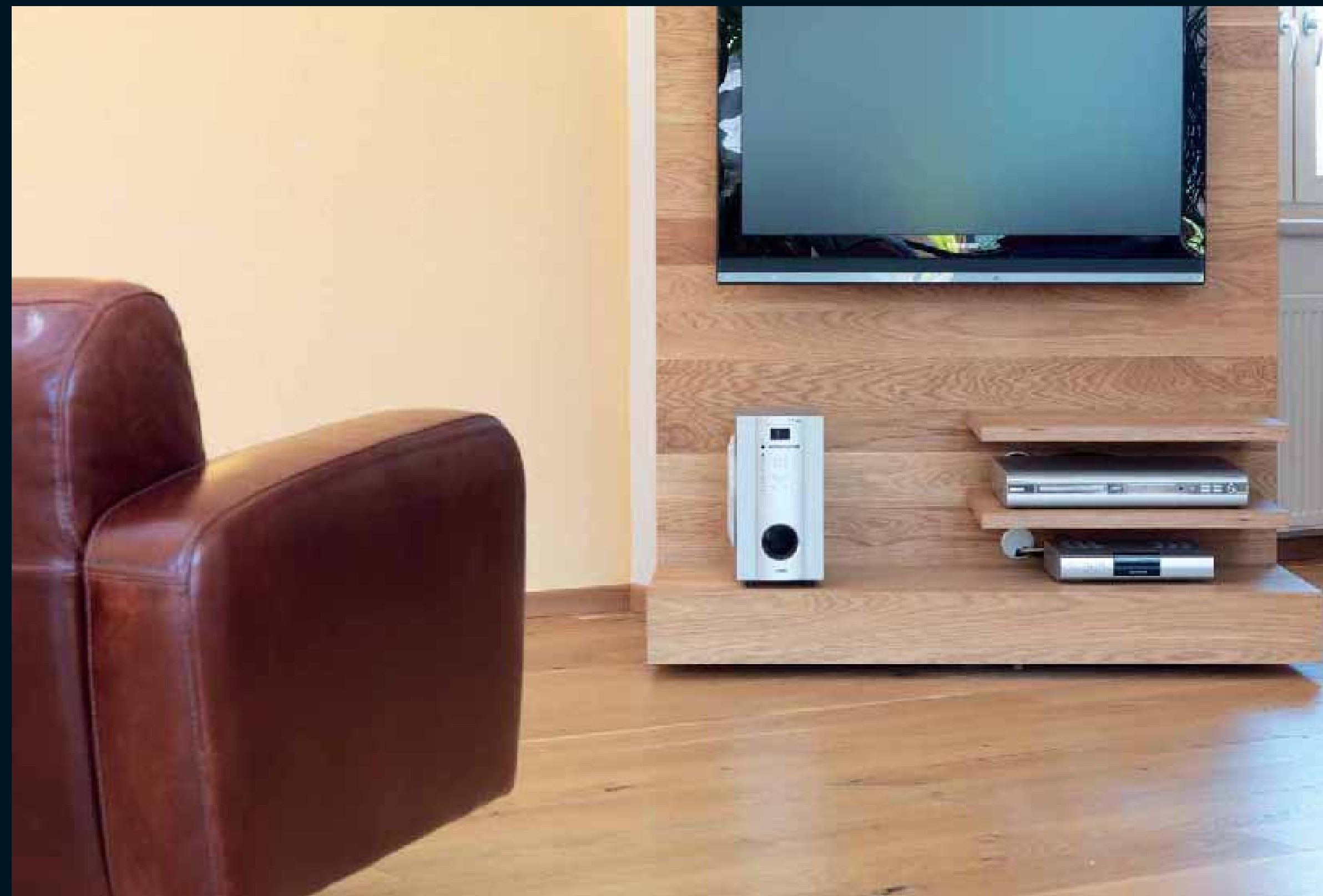
FLOOR: JOHANN EICHE RUSTIKAL / Johann Oak rustic / Johann Chêne rustique / Johann Rovere rustico / Johann Roble „rustico“ PANEL: EICHE / Oak / Chêne / Rovere / Roble