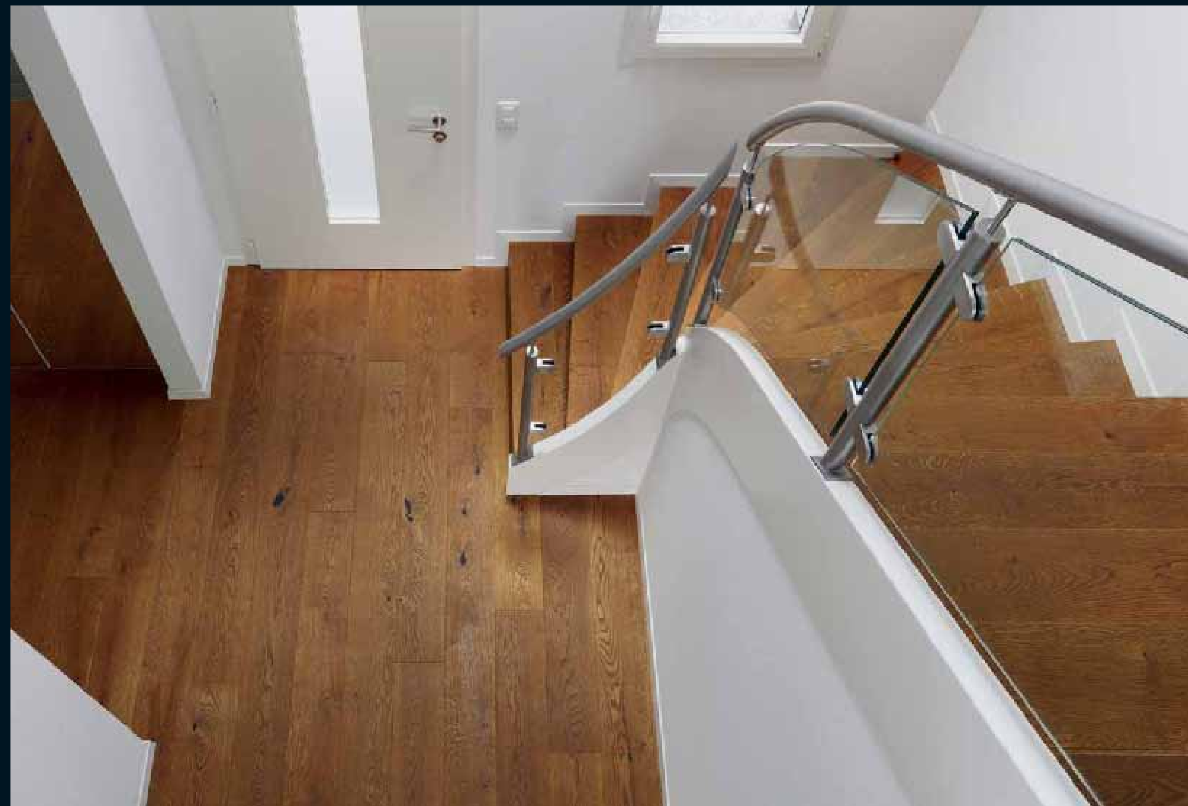
ANTICO EICHE COGNAC / Antico Oak Cognac / Antico Chêne Cognac / Antico Rovere Cognac / Antico Roble Cognac