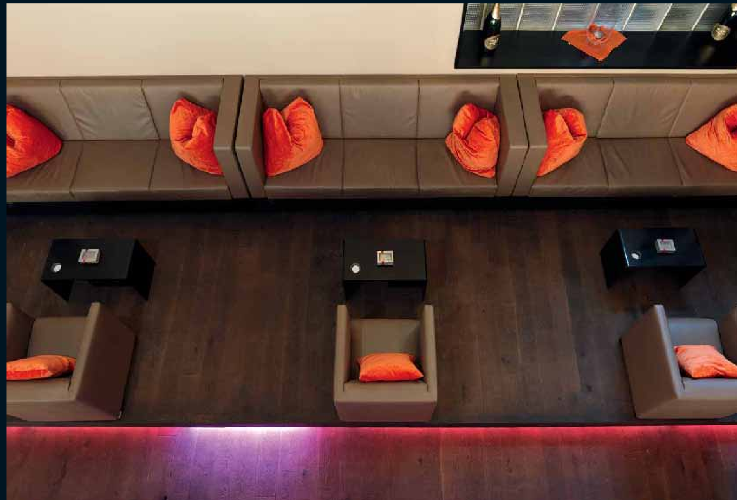
ANTICO EICHE SCURO / Antico Oak Scuro / Antico Chêne foncé / Antico Rovere Scuro / Antico Roble Scuro